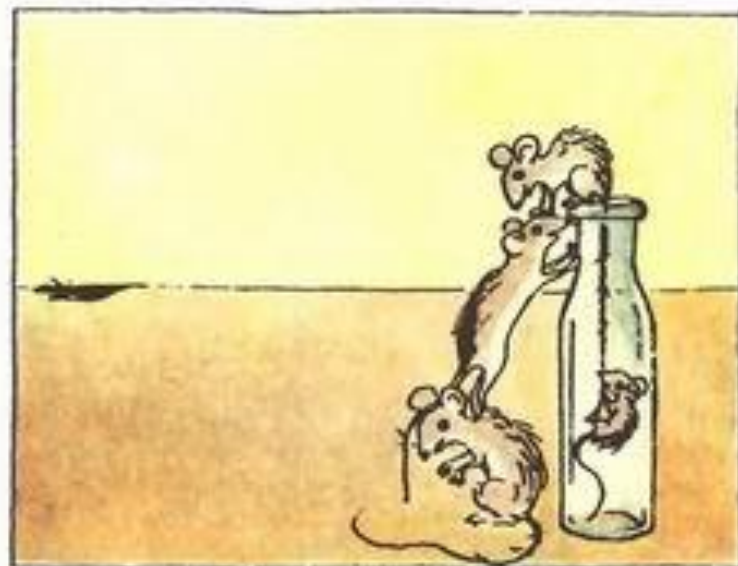
Лезет пленник по канату.