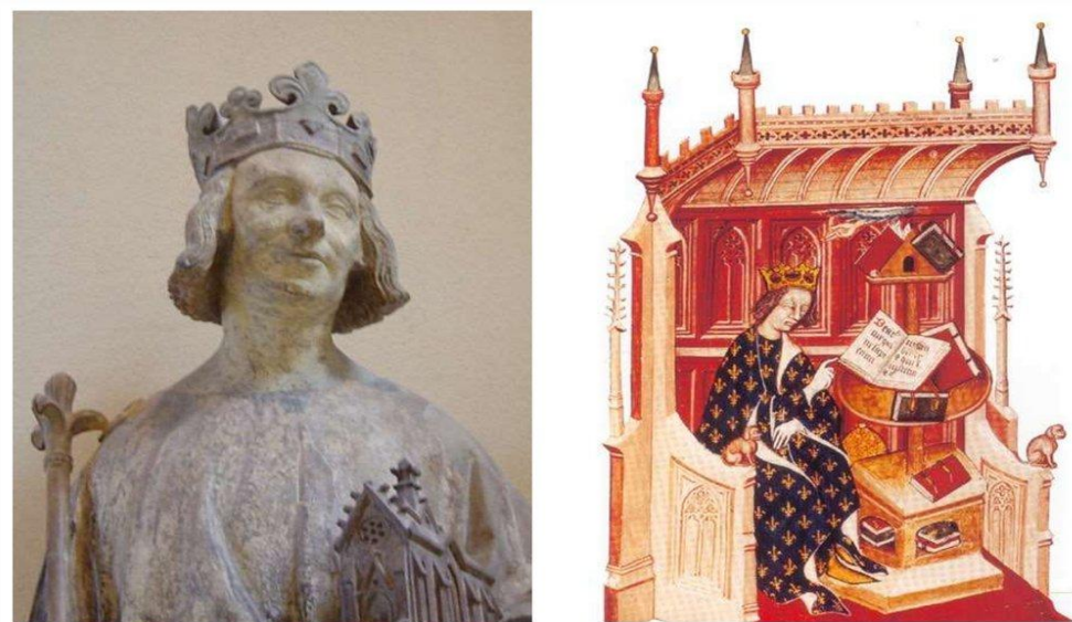
Карл V Валуа (Мудрый)