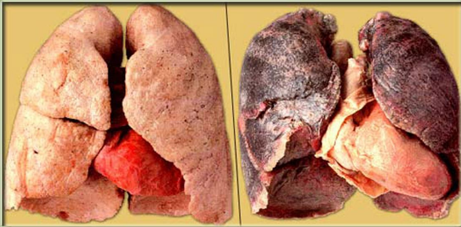
Легкие здорового человека