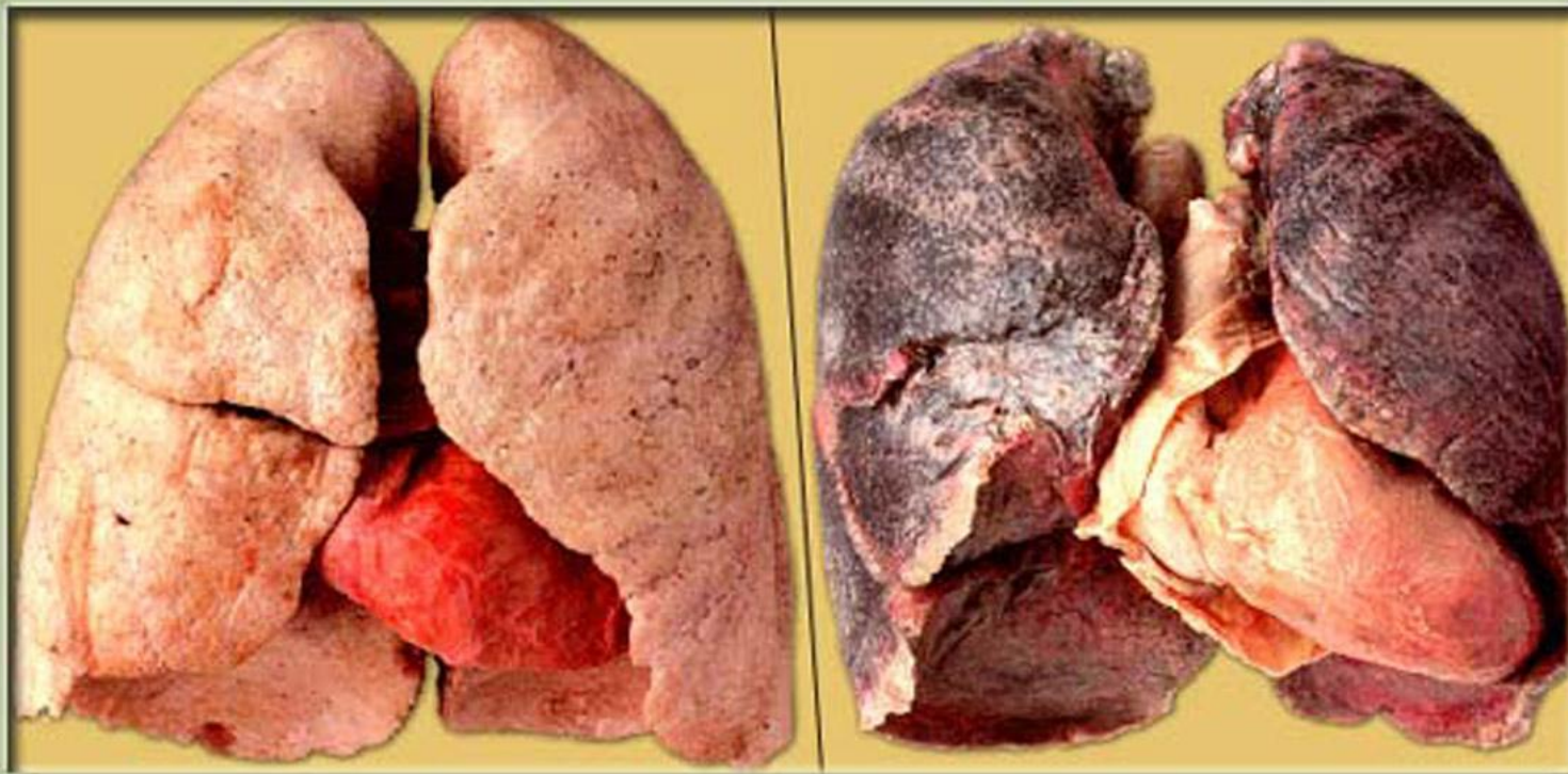
Легкие здорового человека