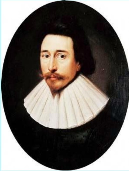
Политический философ Роберт Филмер (1588 — 26 мая 1653)