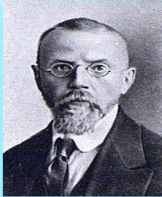
Историк Михаил Николаевич Покровский (1868-1932)