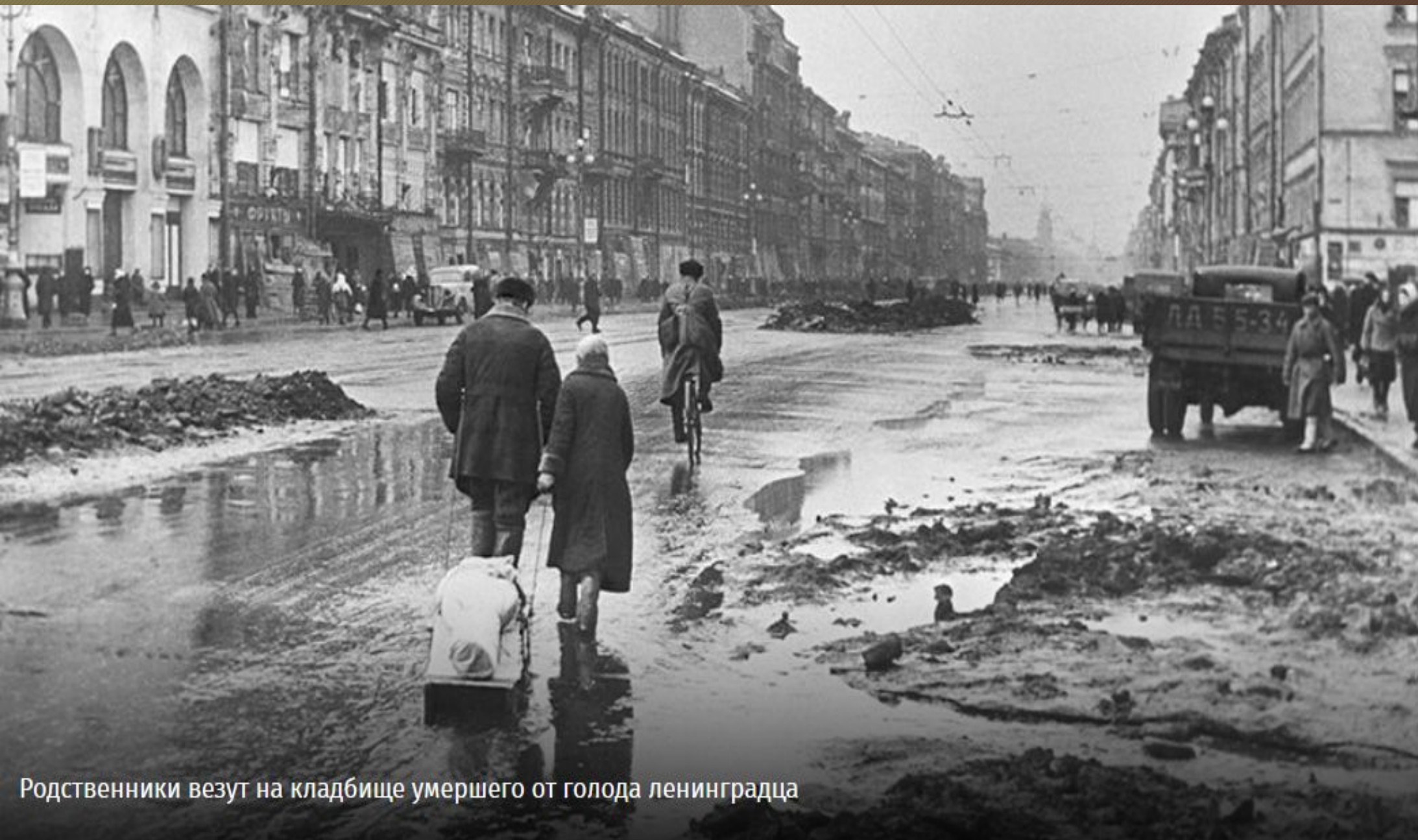
Родственники везут на кладбище умершего от голода ленинградца