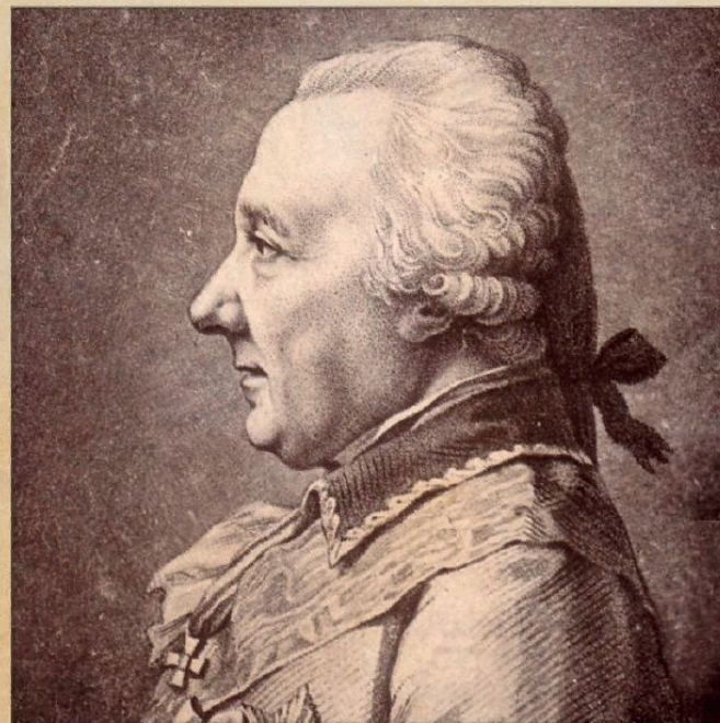
— • ПЕТР ИВАНОВИЧ МЕЛИССИНО • —