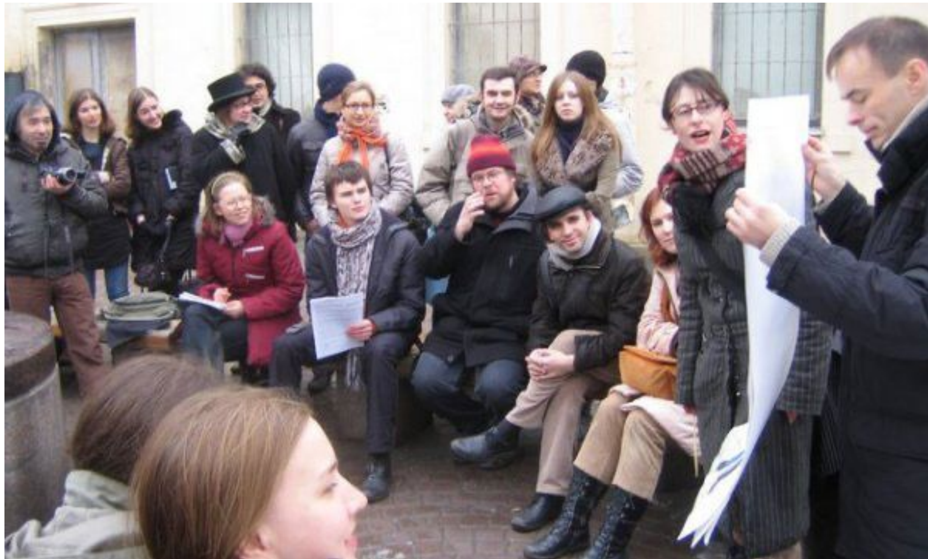
Уличный университет, Санкт-Петербург, Соляной переулок. Научно-практическая конференция «Когда студенты выходят на улицу...». Секция 2. Протест и травестия