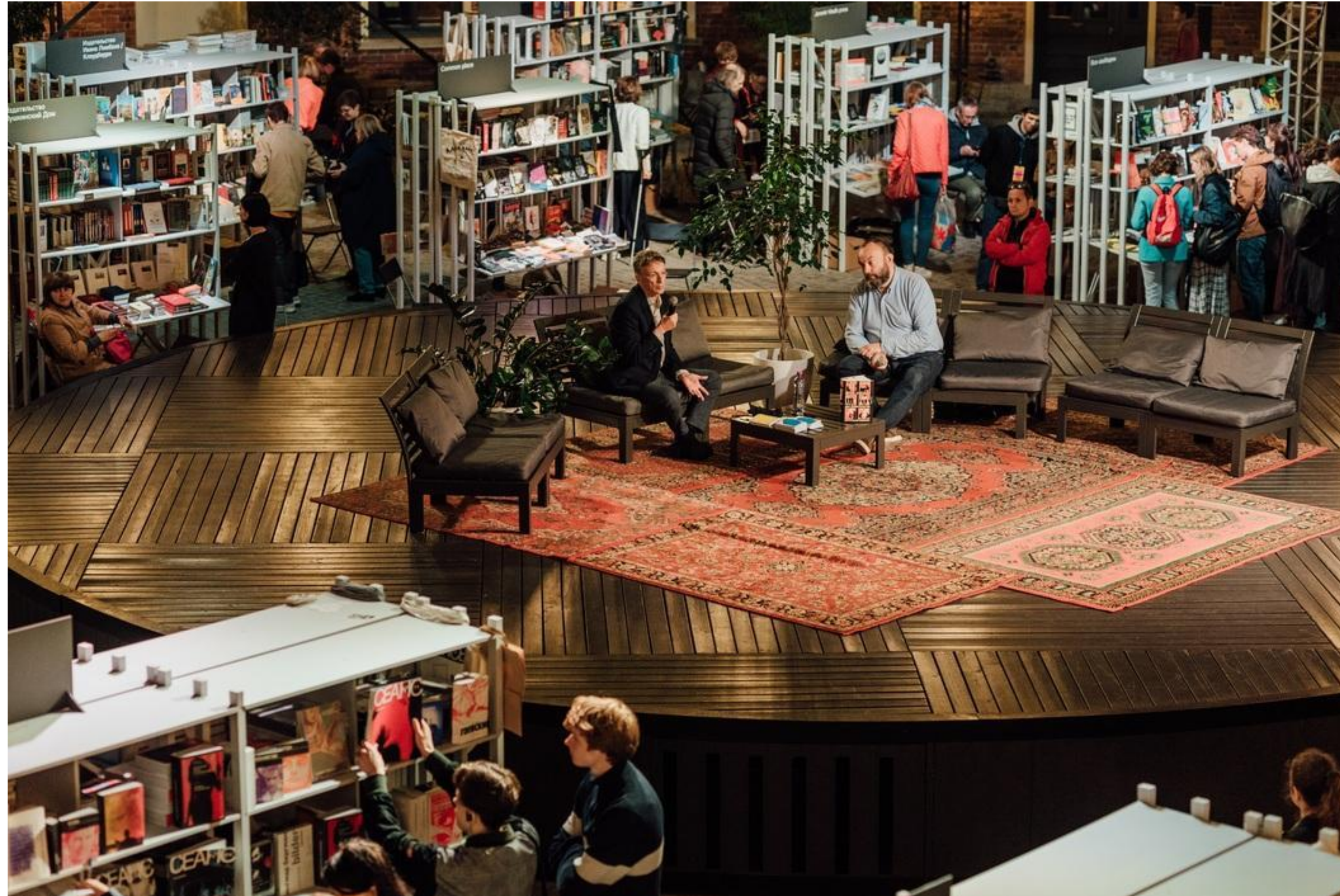
Публичная беседа Юрия Слезкина («Дом правительства», 2017) и Бориса Куприянова («Фаланстер», Gorky.media), Новая Голландия, книжный фестиваль «Ревизия», 6 сентября 2019