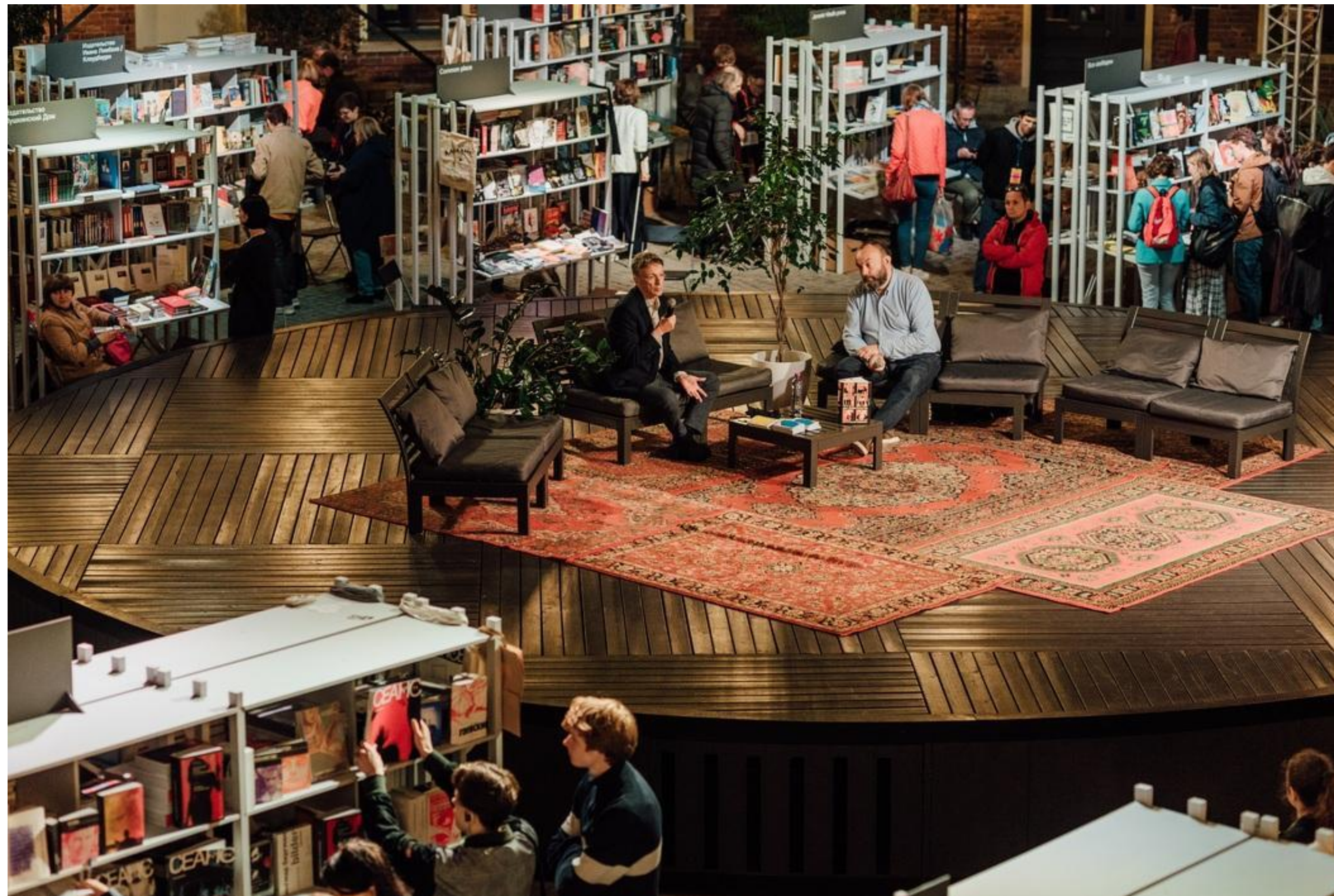
Публичная беседа Юрия Слезкина («Дом правительства», 2017) и Бориса Куприянова («Фаланстер», Gorky.media), Новая Голландия, книжный фестиваль «Ревизия», 6 сентября 2019