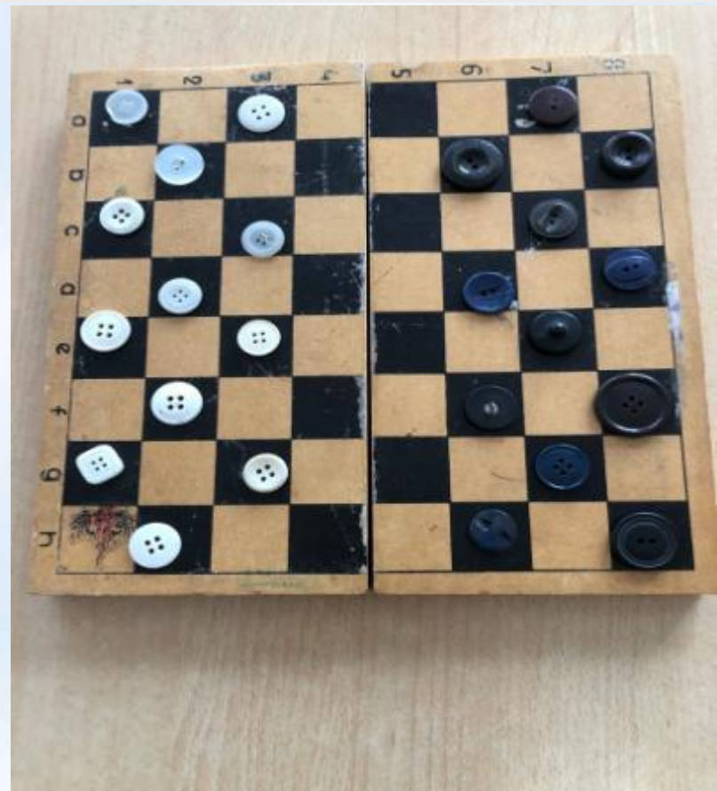
Пуговицы и пробки