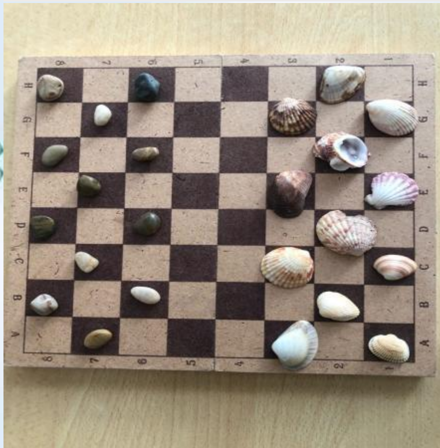
Камешки и ракушки