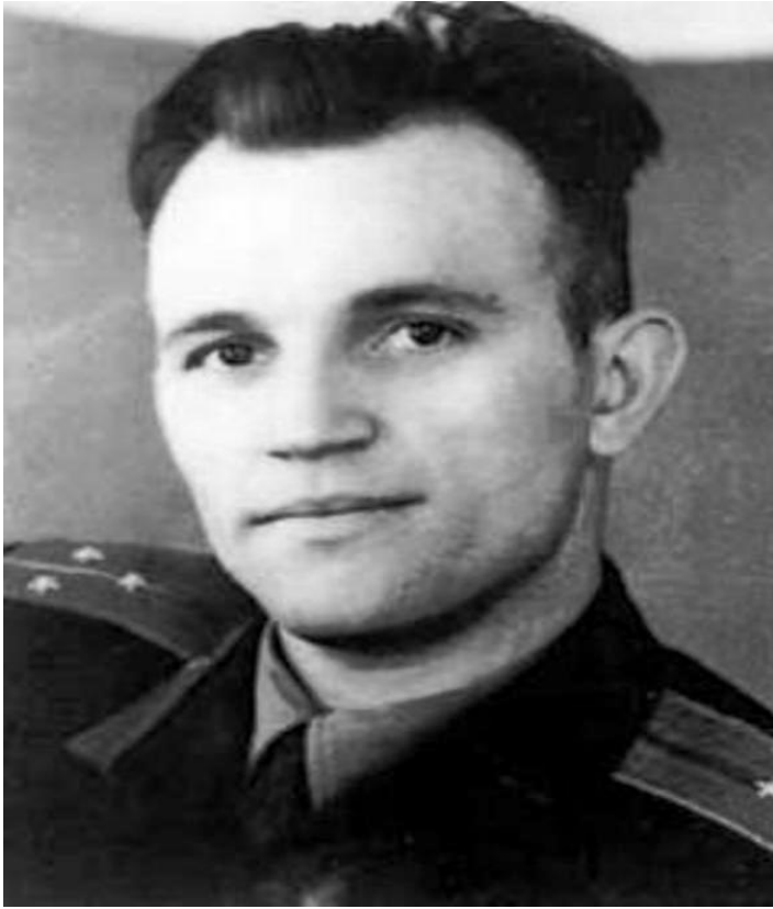
Сергей Сафронов- летчик СССР, погибший при взятии американского U-2.