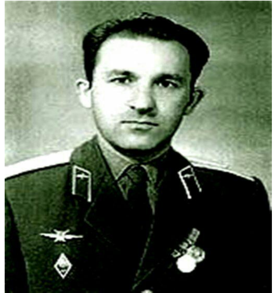
Игорь Меньтюков- летчик СССР, который по приказу совершал таран U-2.