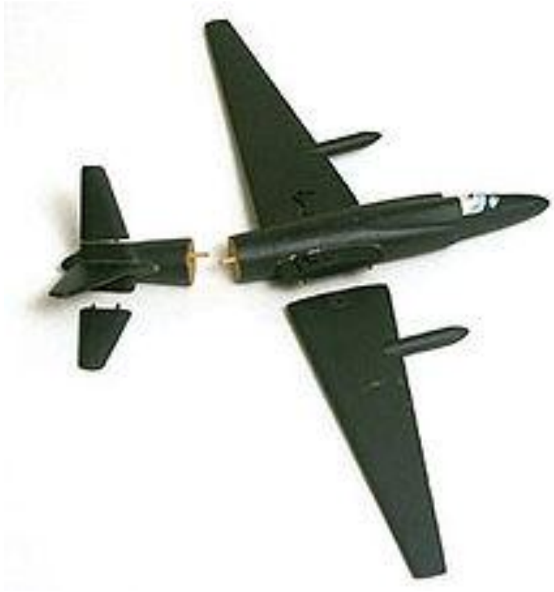
Деревянная модель самолёта, одна из двух, использованных Пауэрсом при даче им свидетельских показаний Сенатскому комитету США.