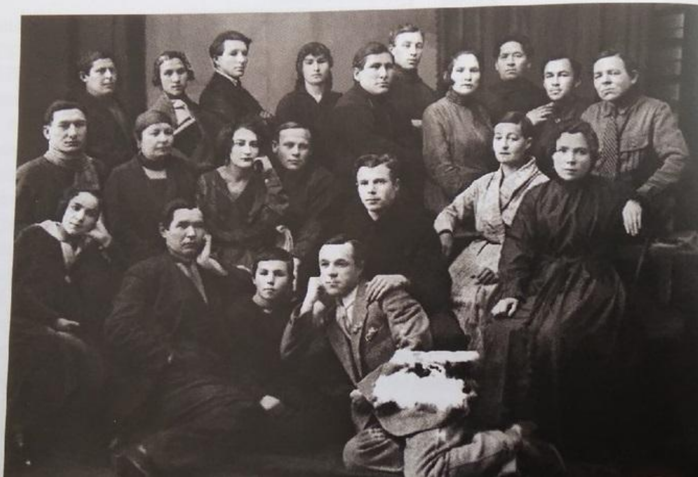
Коллектив Башкирского государственного театра. Зимний сезон 1925 – 1926 годов