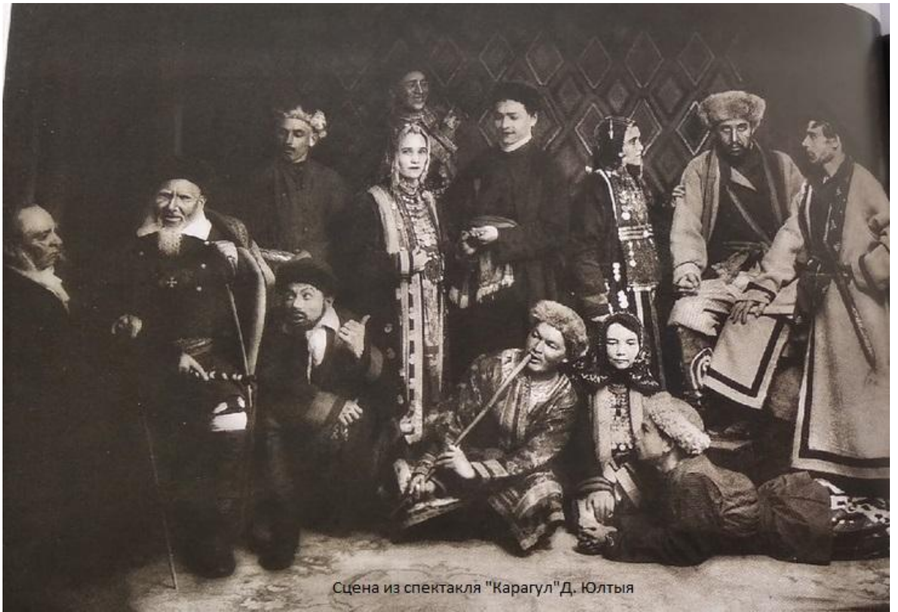
Сцена из спектакля "Карагул" Д. Юлтыя