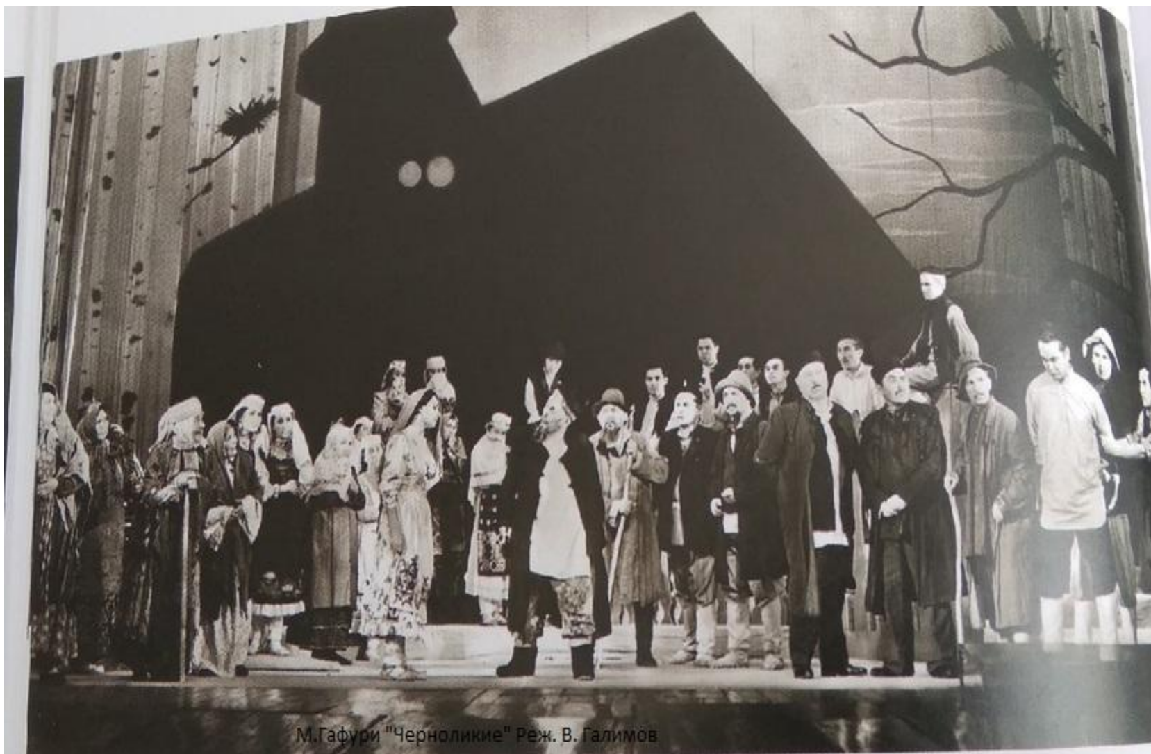
Сцена из спектакля «Черноликые» Режиссер В. Галимов