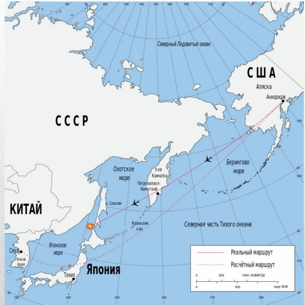
Планный и реальный маршруты рейса 007

На момент катастрофы самолёт отклонился от курса более чем на 500 километров. Согласно расследованию, проведённому Международной организацией гражданской авиации (ИКАО), наиболее вероятной причиной отклонения рейса 007 от маршрута полёта было то, что пилоты неправильно настроили автопилот и не выполняли надлежащих проверок для уточнения текущих координат.