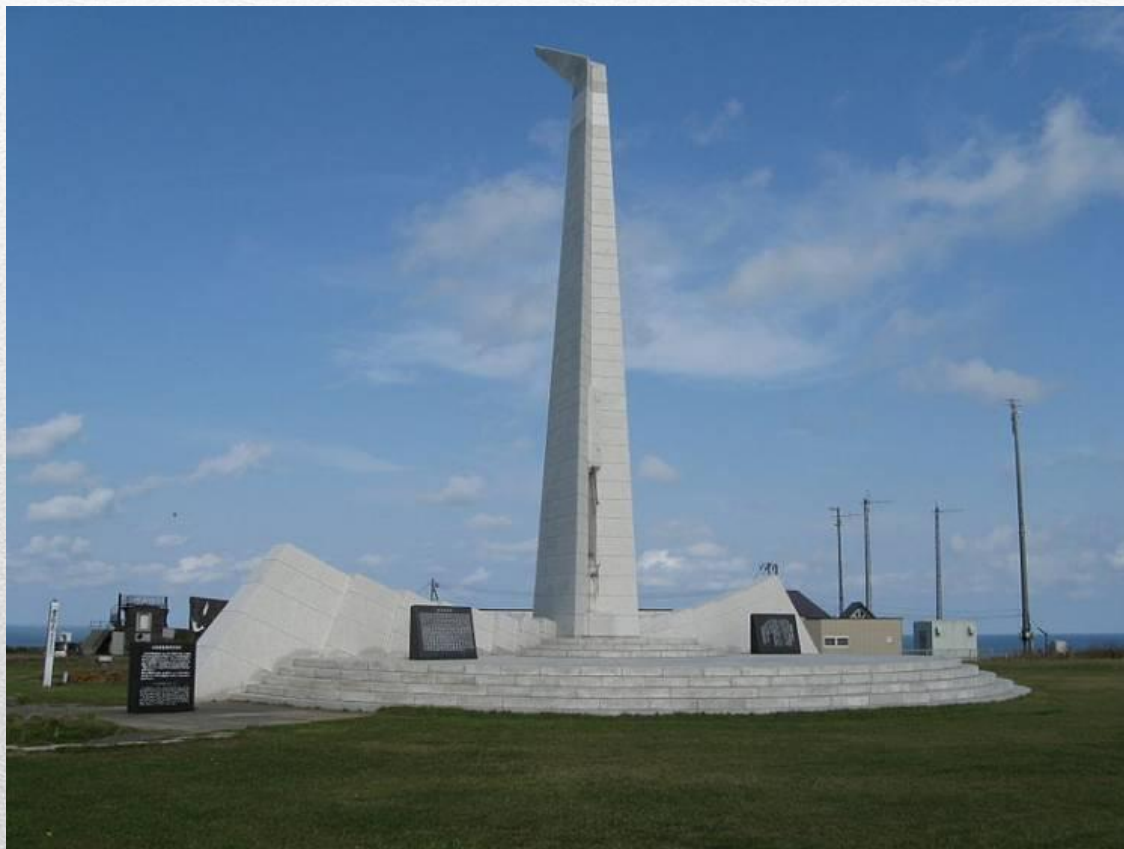
Мемориал рейсу 007 («Молельная башня» на мысе Соя в Японии)

Отмечая годовщину трагедии, 1 сентября 2003 года английская радиокomпания Би-би-си признала, что в истории с южно-корейским «боингом» по-прежнему остается множество загадок