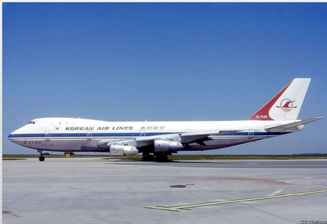
Боинг 747-230В Korean Air Lines

С момента гибели 269 человек , находившихся на борту этого самолета, прошло уже более 30 лет. Однако обстоятельства трагического события с тех пор не только не прояснились, а скорее, напротив, стали еще более загадочными.