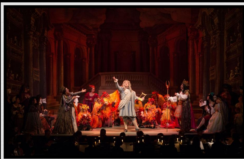
Увертюра к опере "Признанная Европа"