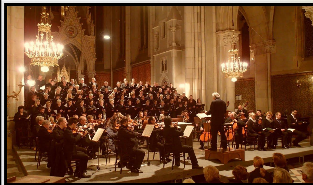
Реквием. Dies irae