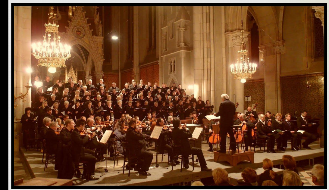
Реквием. Dies irae