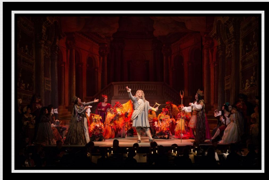
Увертюра к опере "Признанная Европа"