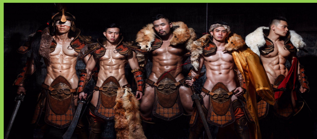
Просто крутые парни В)