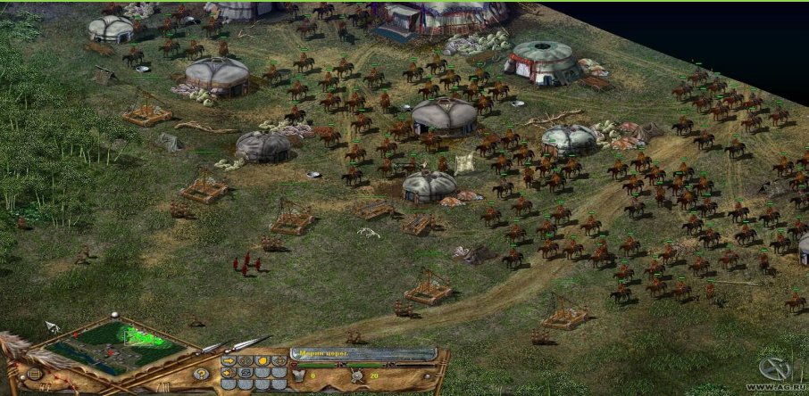
Столица Монголии — Улан-