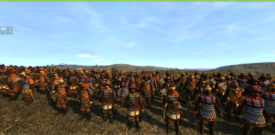
Многонациональная армия Монголии