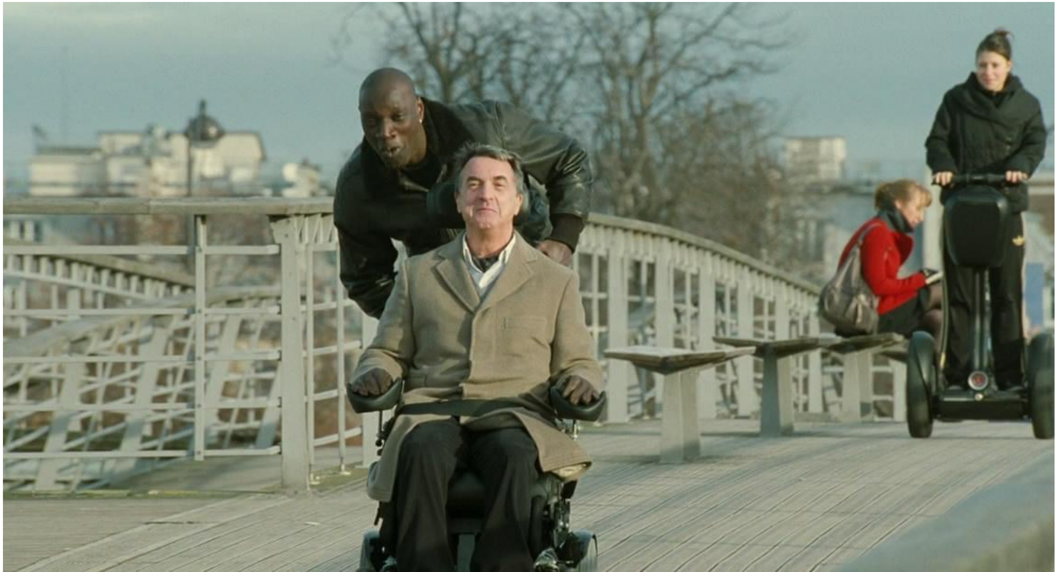
Кадр из фильма «1+1»