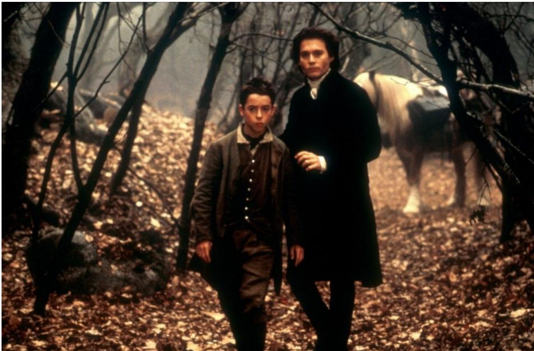
Кадр из фильма «Сонная лощина»