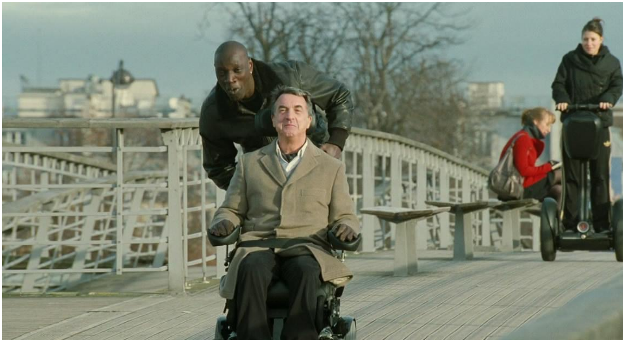
Кадр из фильма «1+1»