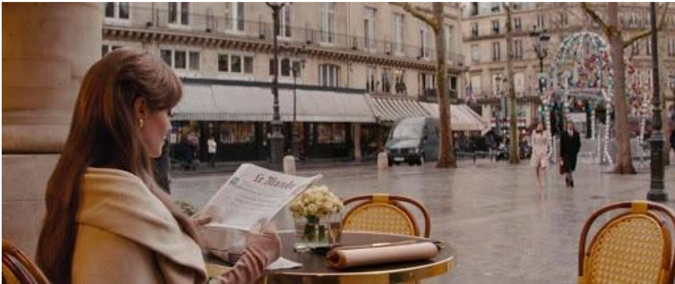
Кадр из филма «Турист»