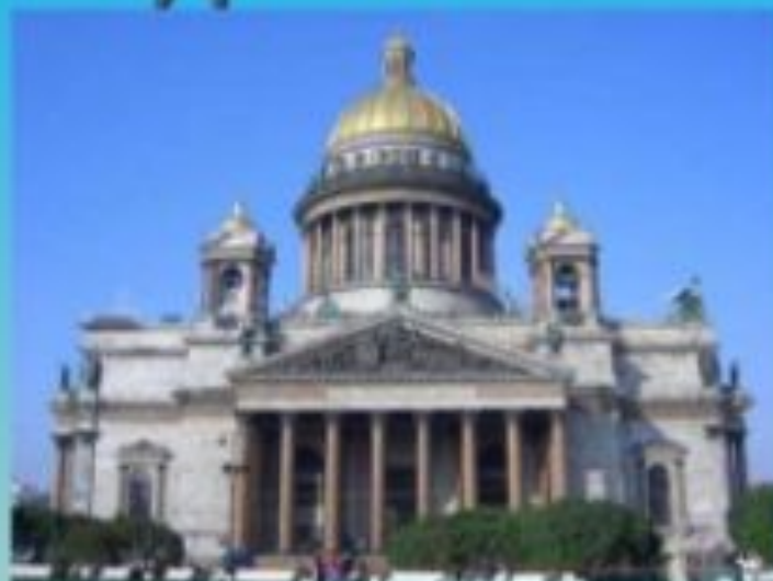
Исаакиевский собор. Санкт – Петербург. А. Монферран