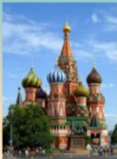
Собор Василия Блаженного. Москва. Барма и Постник