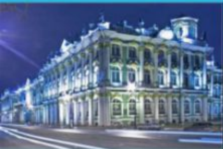
Зимний дворец. Санкт-Петербург. Растрелли.