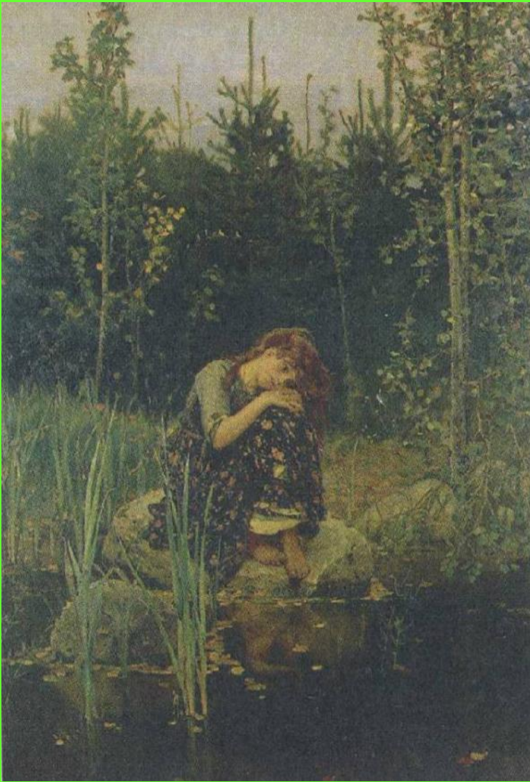
Алёнушка. 1881 г.