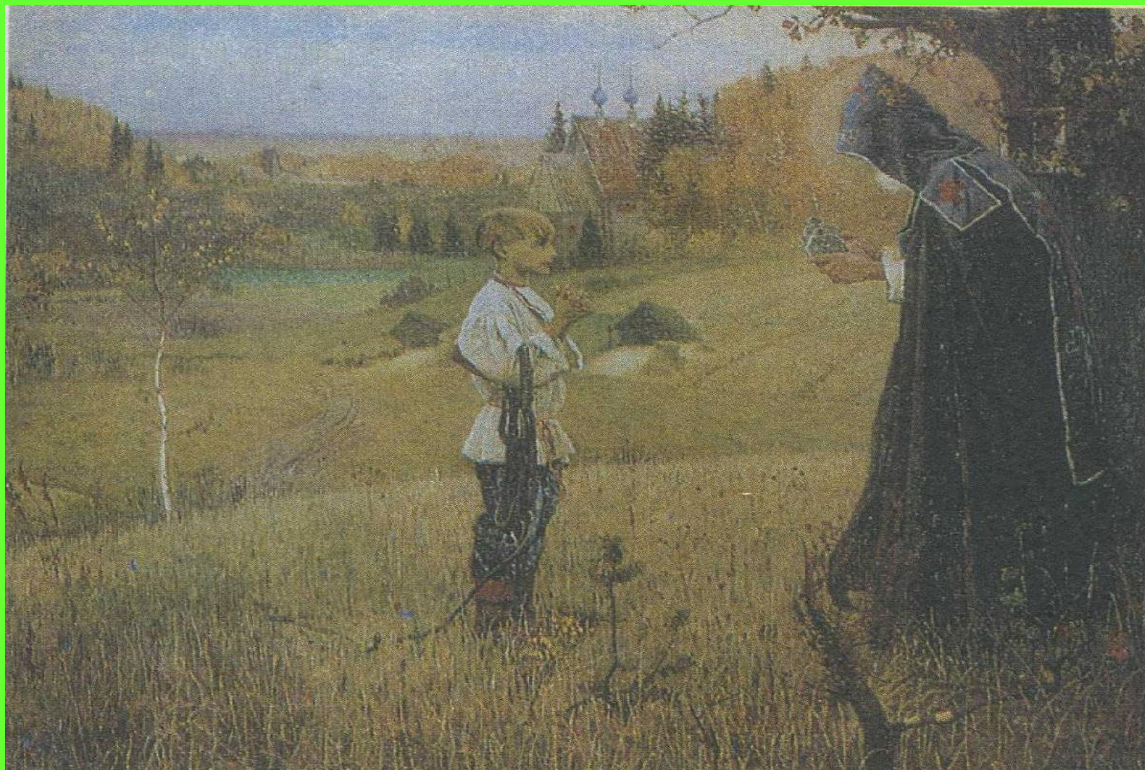
Видение отроку Варфоломею. 1889 г.