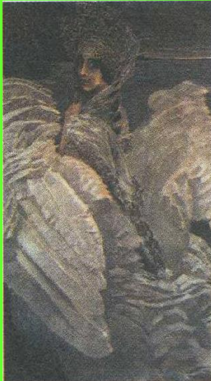
Царевна-лебедь. 1900 г.