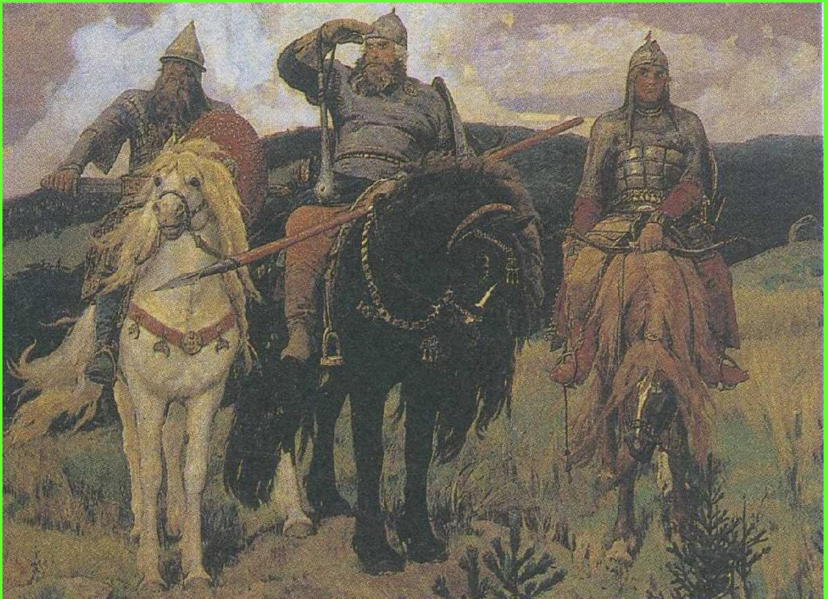
Богатыри. 1898 г.