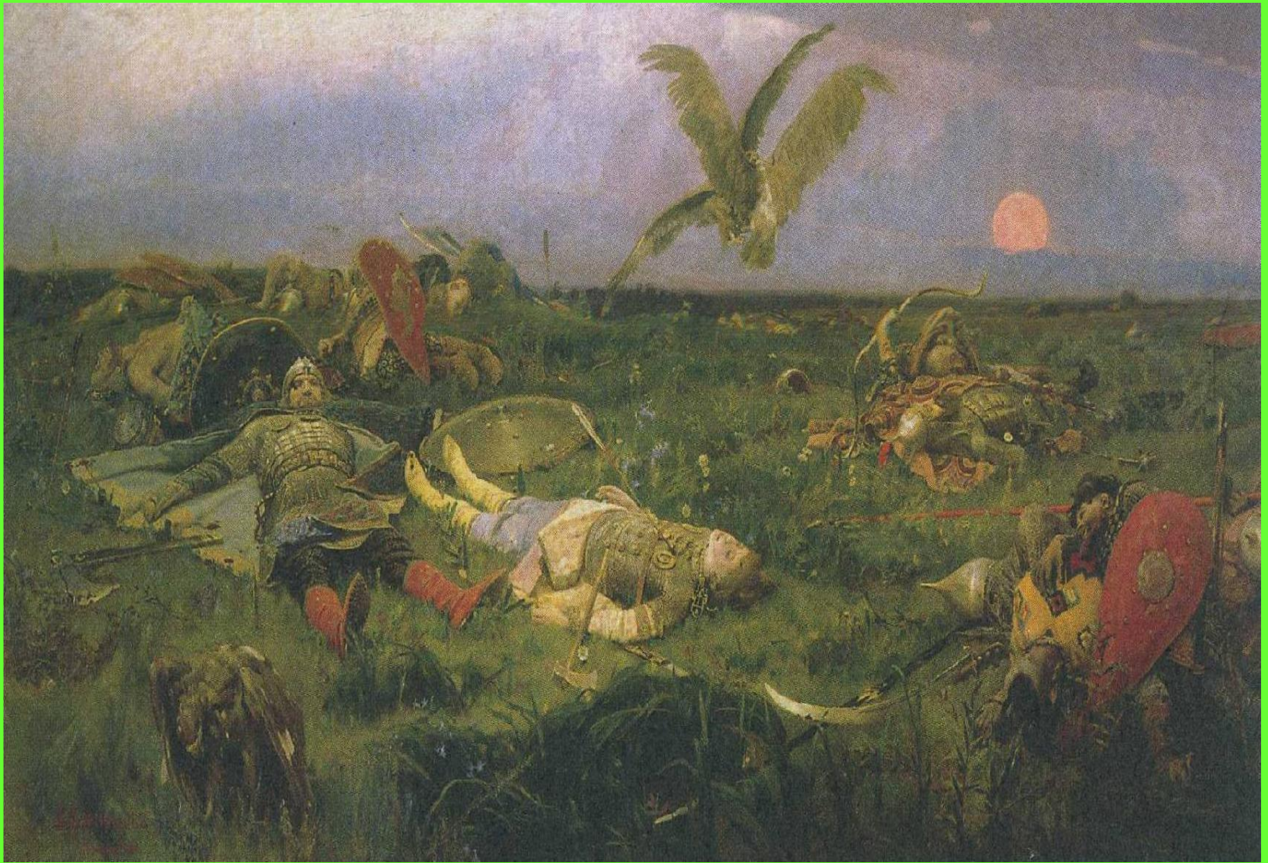
После побоища Игоря Святославовича с половцами. 1880г