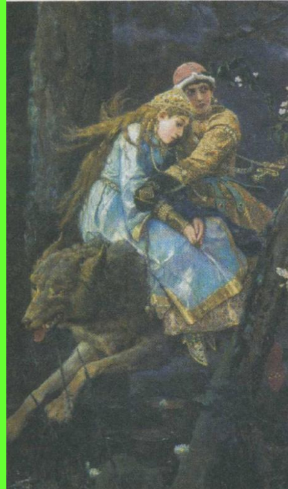
Иван-Царевич на Сером Волке. 1889 г.