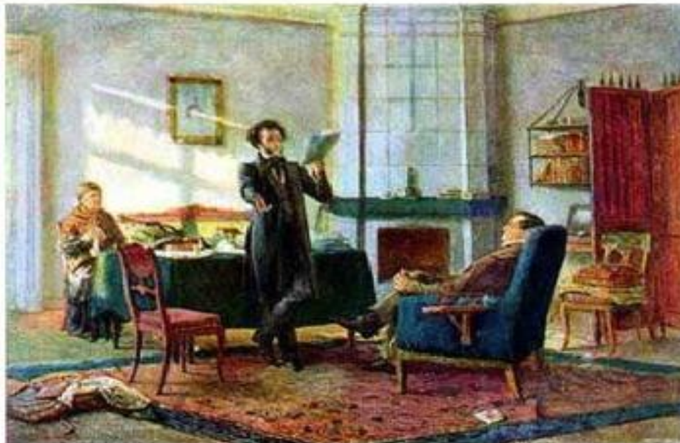
Пушкин в селе Михайловском (Пушкин у Пушкина). Н.Н. Ге. 1875 г.

За три года ссылки написаны "Кавказский пленник", "Бахчисарайский фонтан", а также "Узник", "Песнь о Вещем Олеге". Начат роман в стихах "Евгений Онегин".