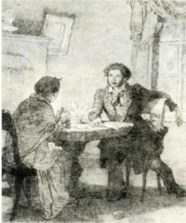
Иллюстрация к стихотворению «Зимний вечер»

Забота и любовь Арины Родионовны скрашивали поэту ссылку. Пушкин по-настоящему крепко любил свою няню и написал несколько трогательных стихотворений, к ней обращенных.