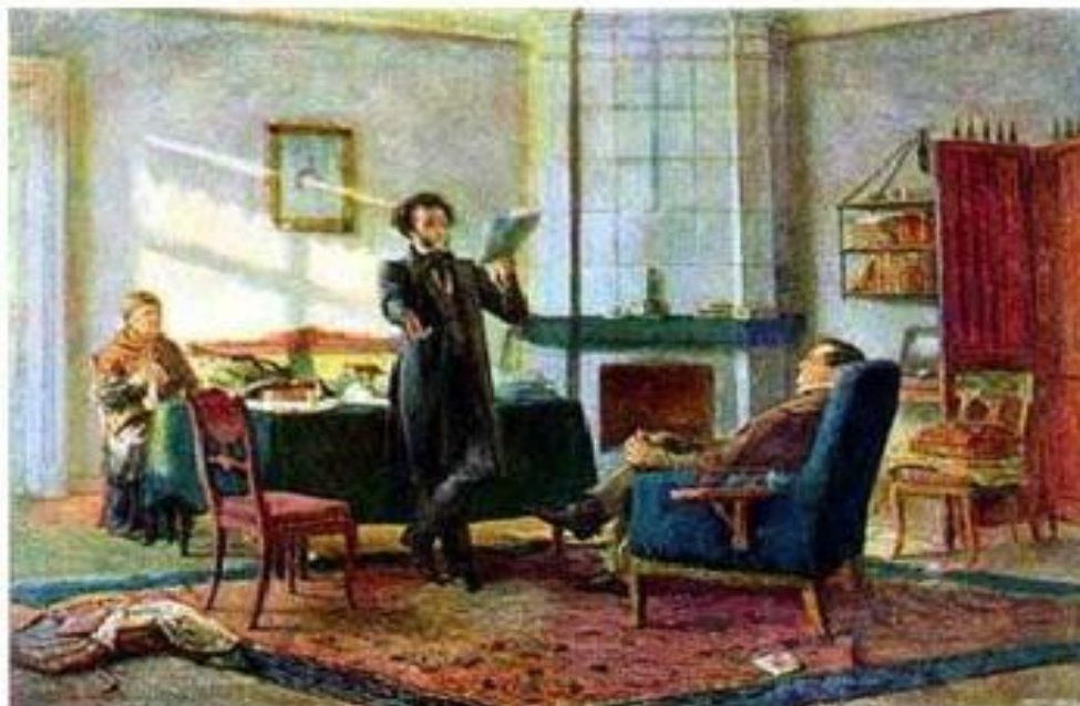
Пушкин в селе Михайловском (Пушкин у Пушкина). Н.Н. Ге. 1875 г.

За три года ссылки написаны "Кавказский пленник", "Бахчисарайский фонтан", а также "Узник", "Песнь о Вещем Олеге". Начат роман в стихах "Евгений Онегин".