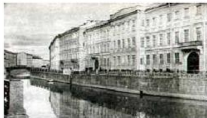
Квартира Пушкина в Петербурге на Набережной Мойки

С середины октября 1831 г. и уже до конца жизни Пушкин с семьей живет в Петербурге.