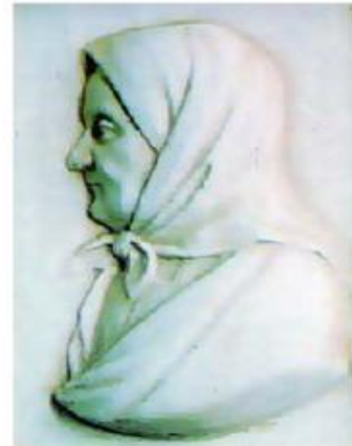
Яковлева Арина Родионовна

Любовь к родному языку маленькому Пушкину привили бабушка, Мария Алексеевна Ганнибал, превосходно говорившая и писавшая по-русски, и няня Арина Родионовна.