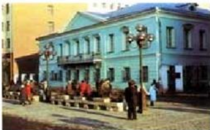
Квартира Пушкина в Москве на Арбате

18 февраля 1831 г. в церкви Вознесения Господня состоялось его венчание с Н.Н.Гончаровой. Первые месяцы семейной жизни он провел с женой в Москве, сняв квартиру на Арбате