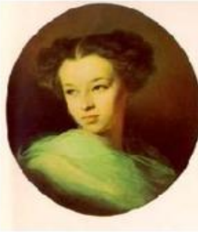
Младшая дочь, Наталья Александровна Пушкина (1836-1913г.)

У А.С.Пушкина и Натальи Гончаровой было четверо детей.