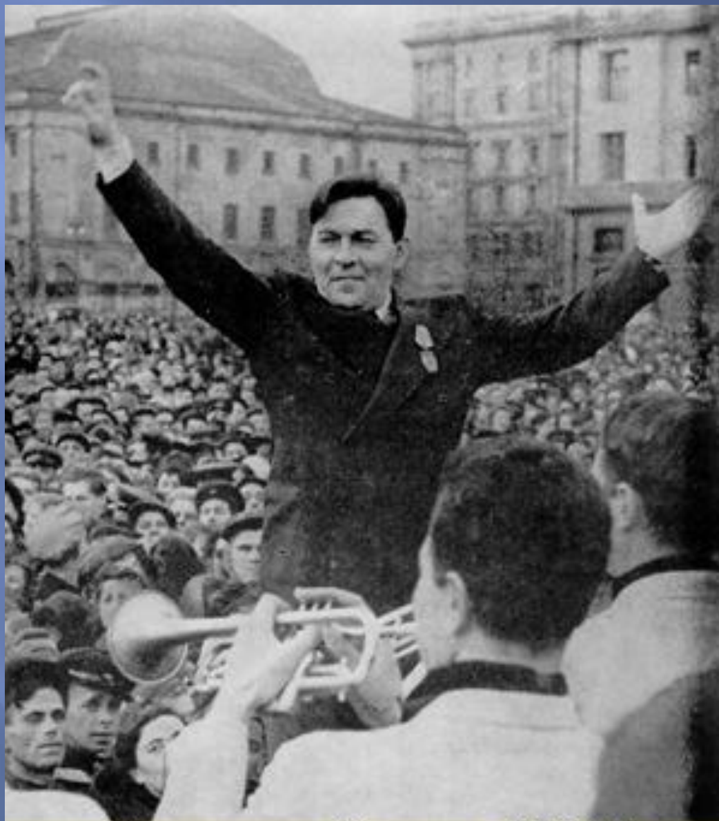
Выступление Госджаза РСФСР п/у Л.Утесова на площади Свердлова в Москве 9 мая 1945 года.