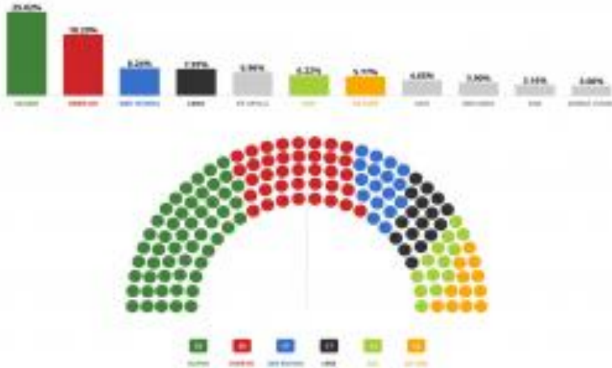
Výsledky parlamentných volieb 2020