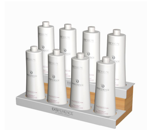
Подставка для больших объемов