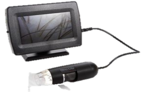
Микроскоп (без комп)