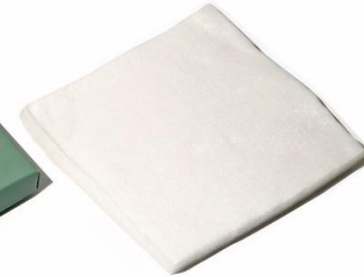
Полотенца и пеньюары