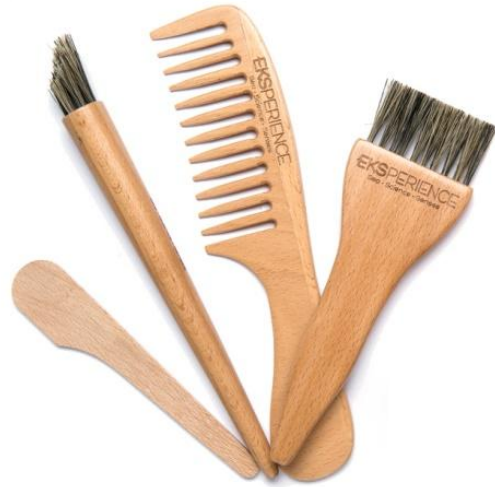
Кисточки и расчески