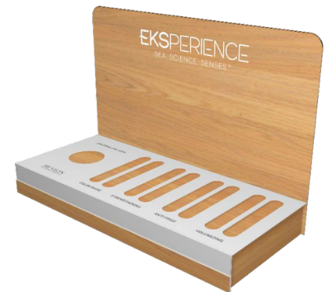
Дисплей для бустер-доз