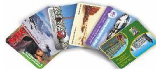
Карманный календарь (70x100 мм)