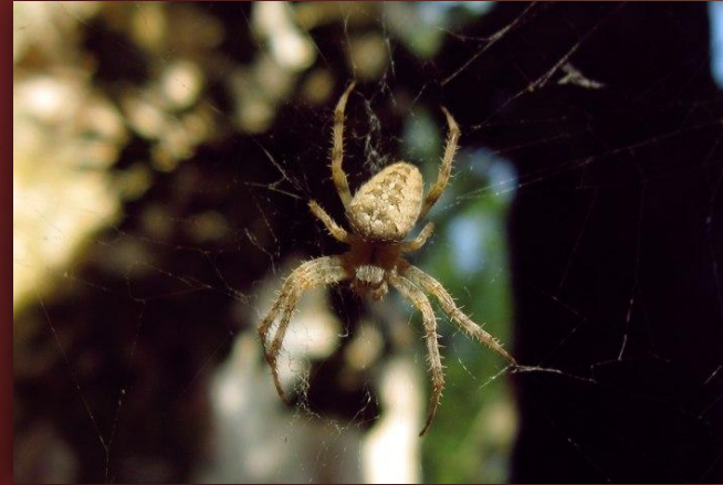
Говорят, что в окрестностях, самой усадьбе и особенно ее подвалах много змей и пауков.