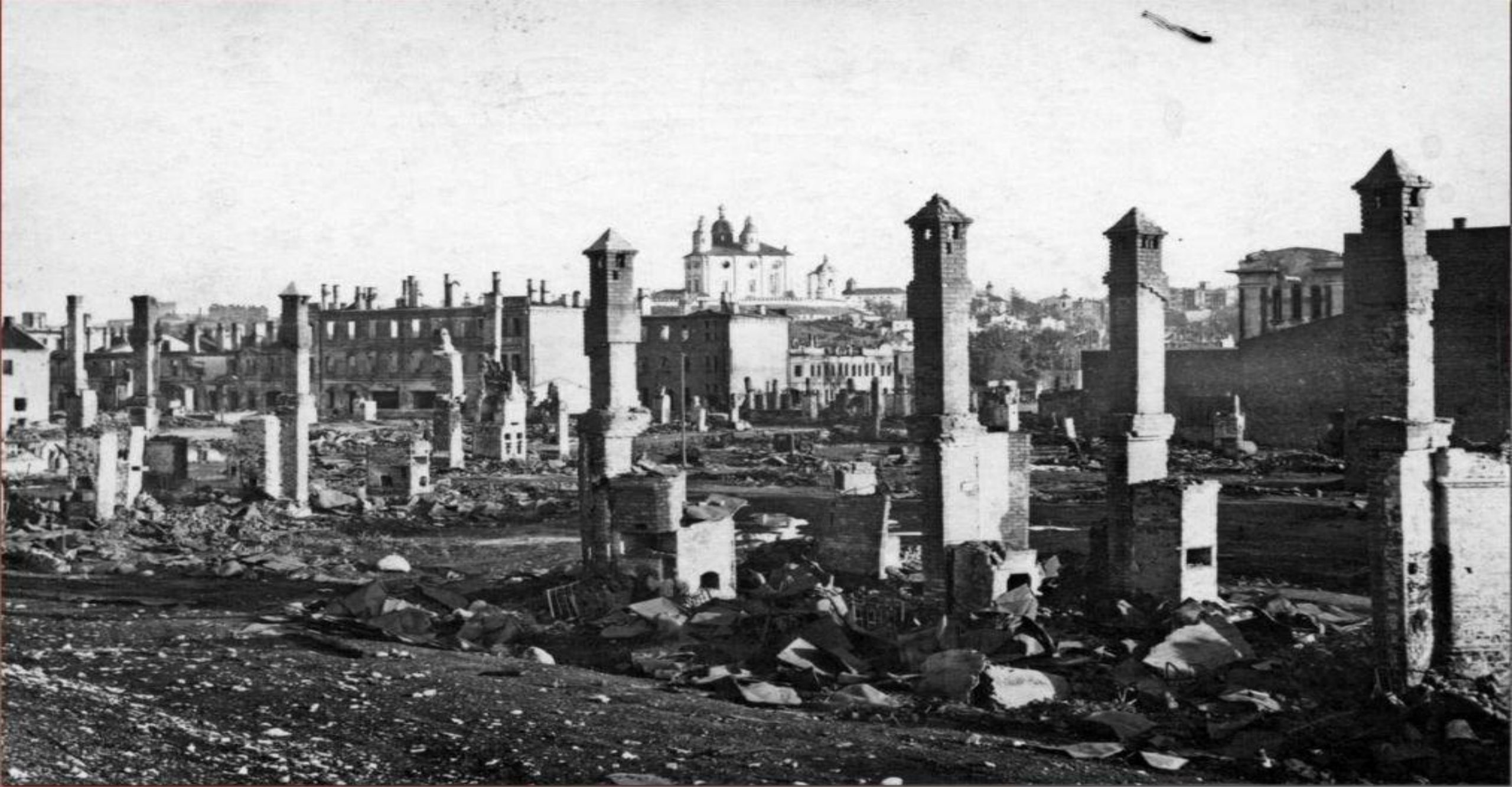
Смоленск после отступления фашистов.