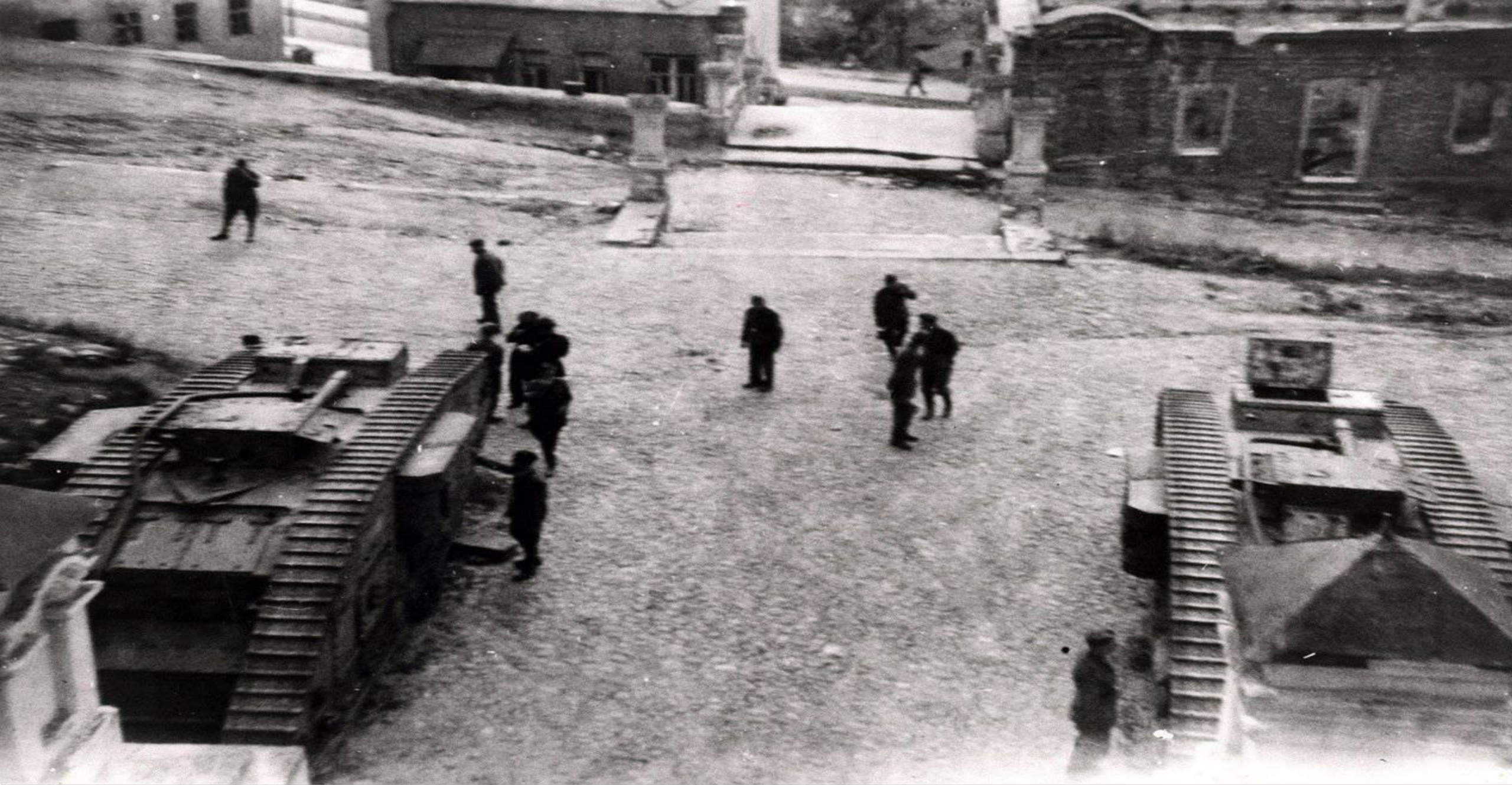
Гитлеровские солдаты у стен Свято-Успенского кафедрального собора, где с 1933 по 1941 гг. располагался антирелигиозный музей.