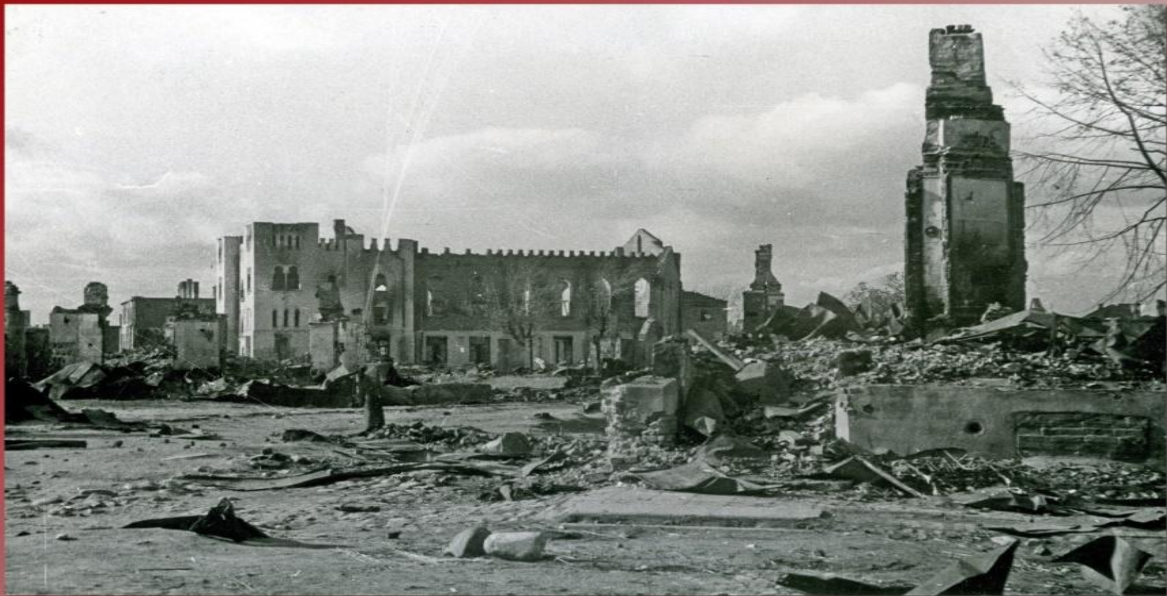
Район кинотеатра "Пятнадцатый" (ныне - здание колледжа связи).