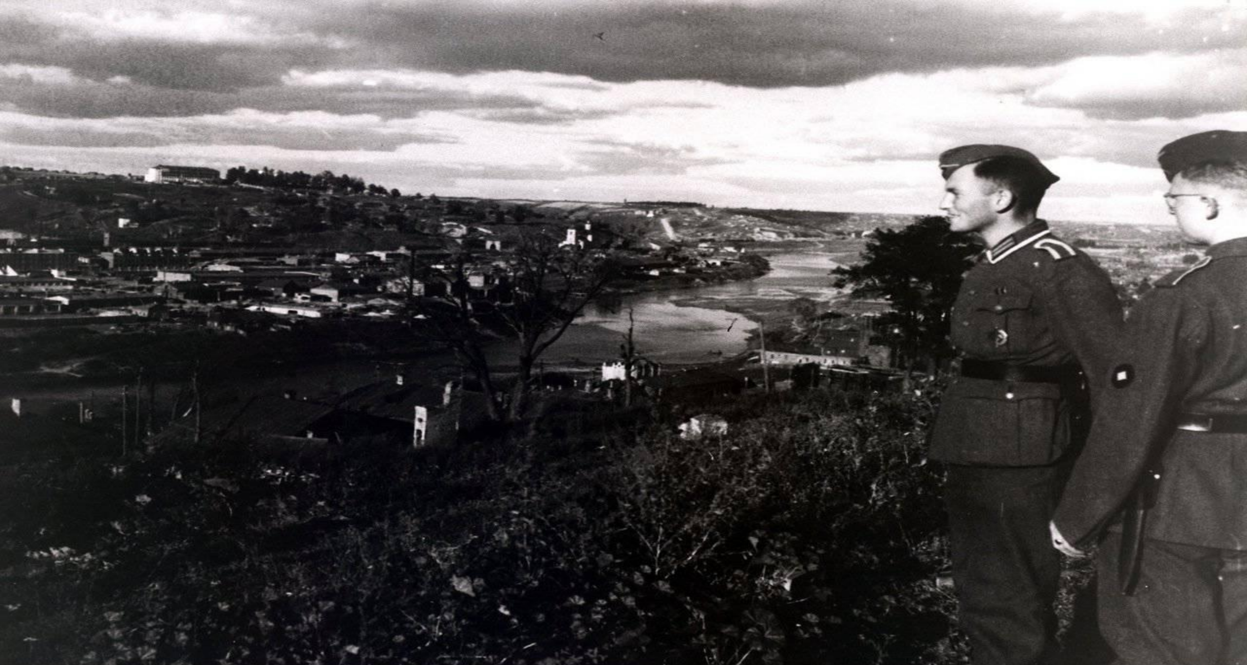
Немецкие солдаты у Днепра.