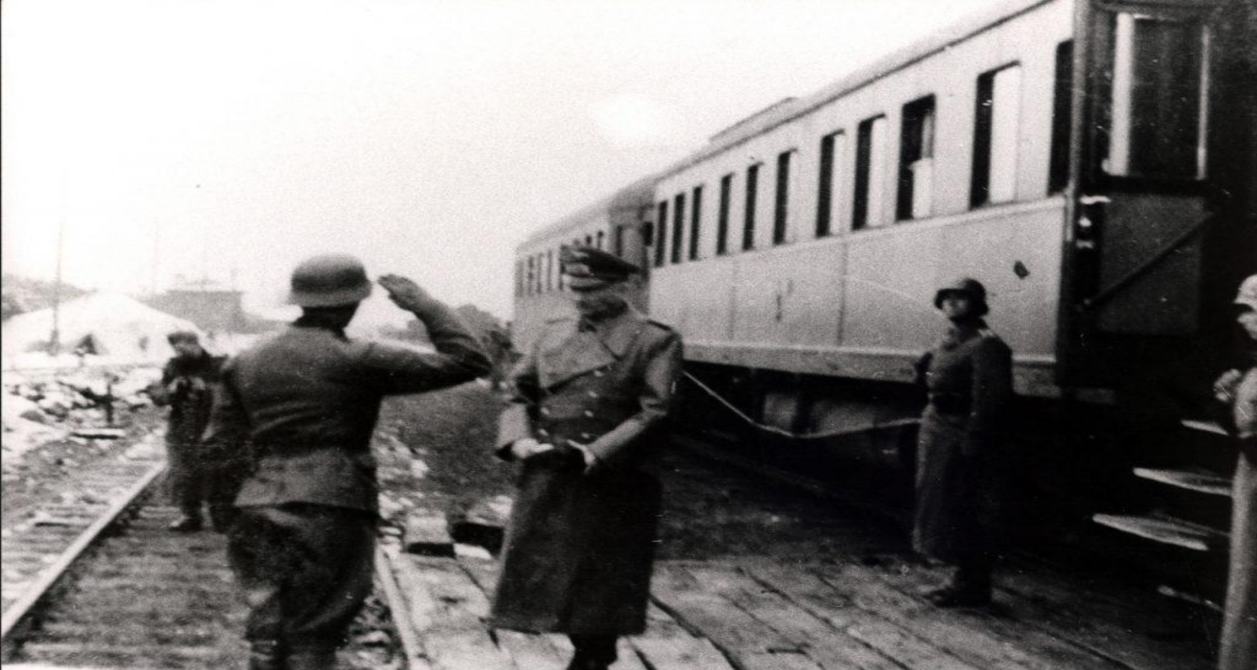
Прибытие командующего группой армий "Центр" (с декабря 1941 г.), фельдмаршала Ганса Гюнтера фон Клюге в Смоленск.