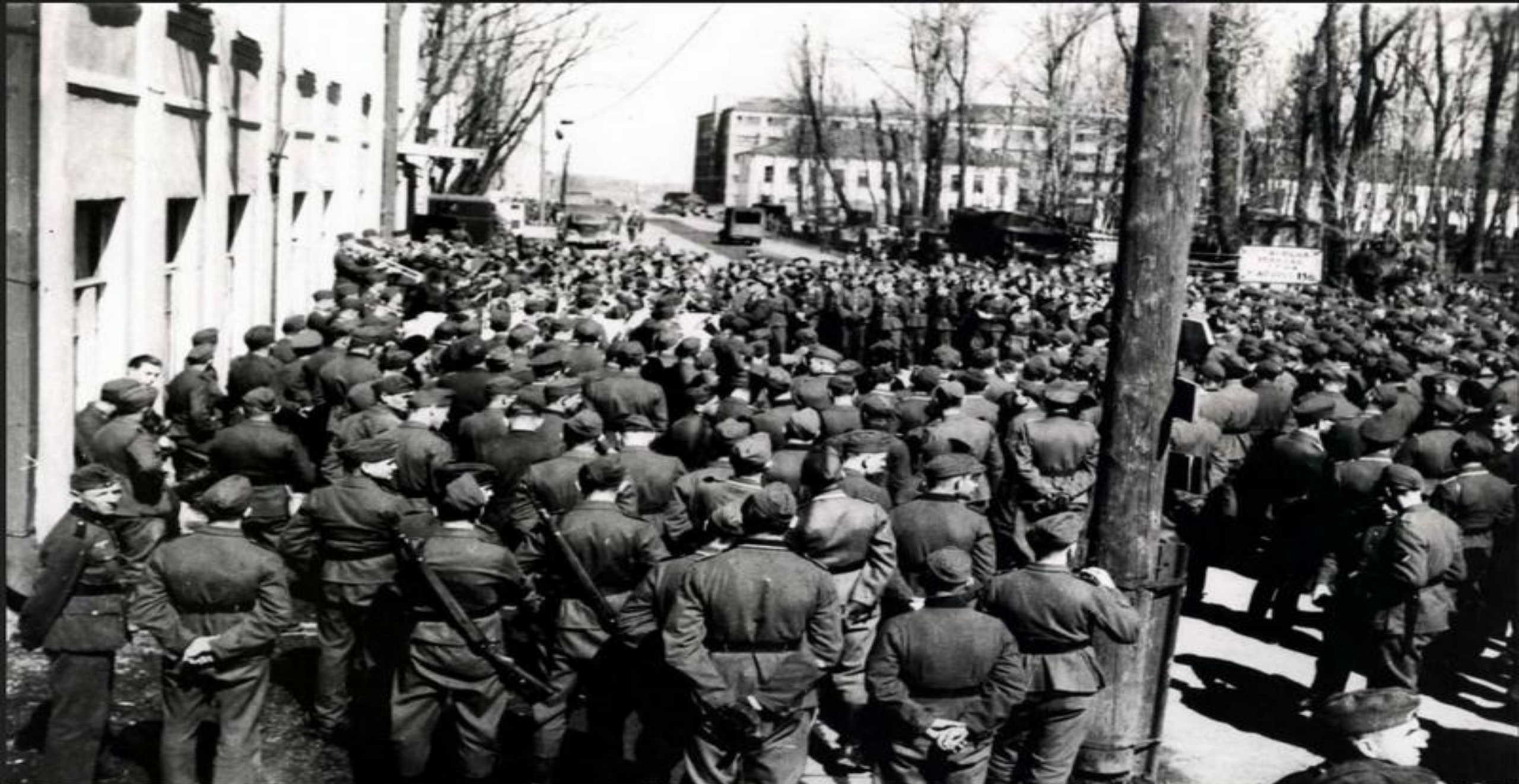
Концерт для немецких солдат у здания детской музыкальной школы (ныне - детская художественная школа) по улице Магистратской (ныне - ул. Маяковского). Здесь с сентября 1941 г. располагалась биржа труда.