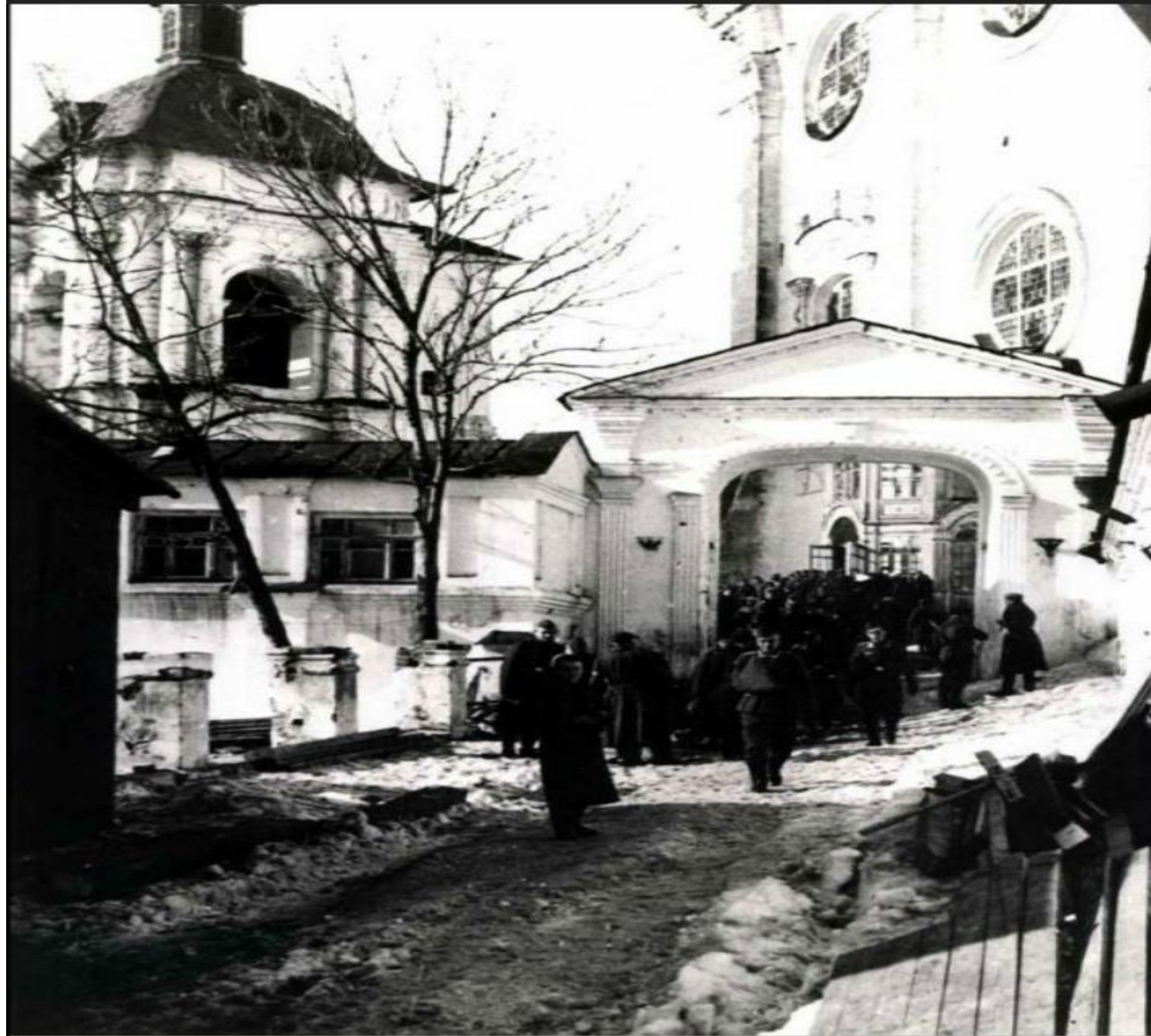
Гитлеровские солдаты у стен Свято-Успенского кафедрального собора.