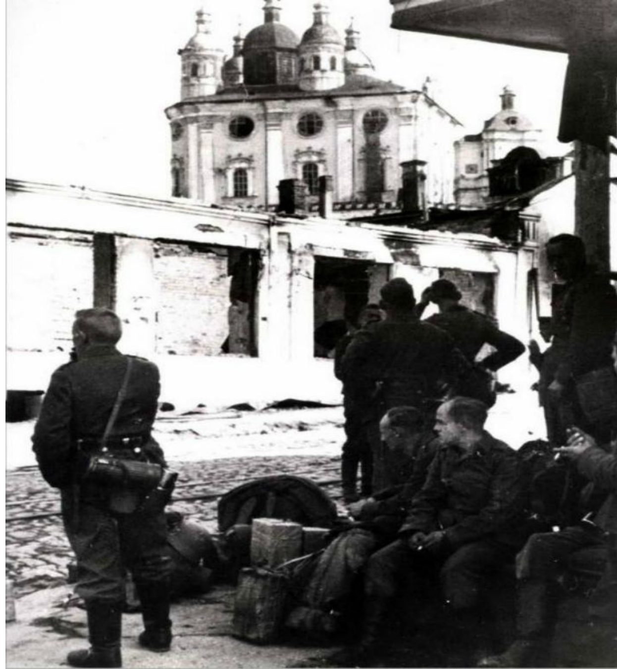
Гитлеровские солдаты у стен Свято-Успенского кафедрального собора.