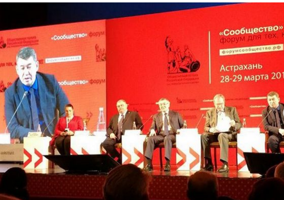
Форум «Сообщество» г. Астрахань, 28-29 марта 2018