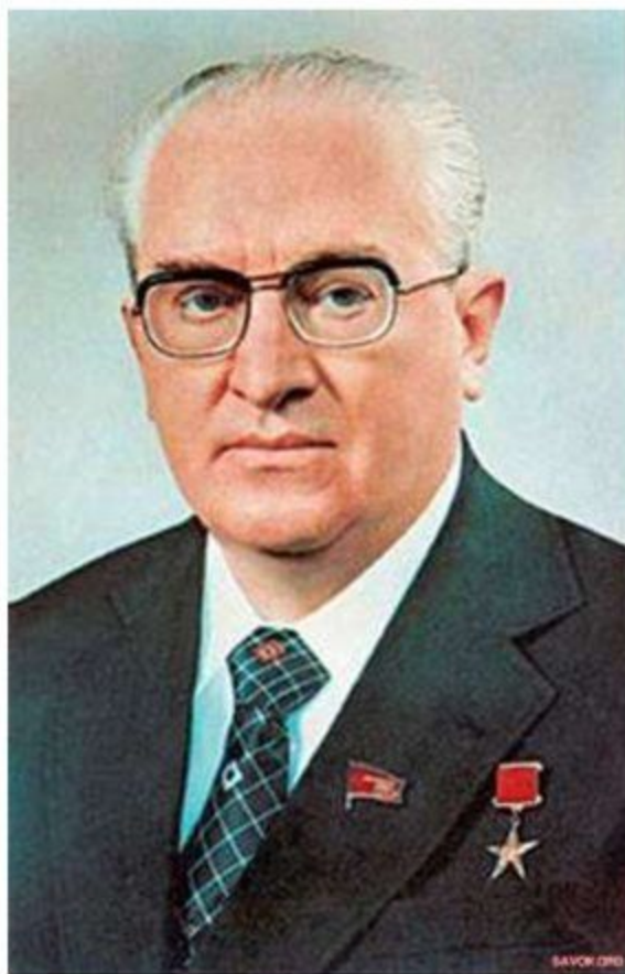
Ю.В. Андропов 1982 - 1984