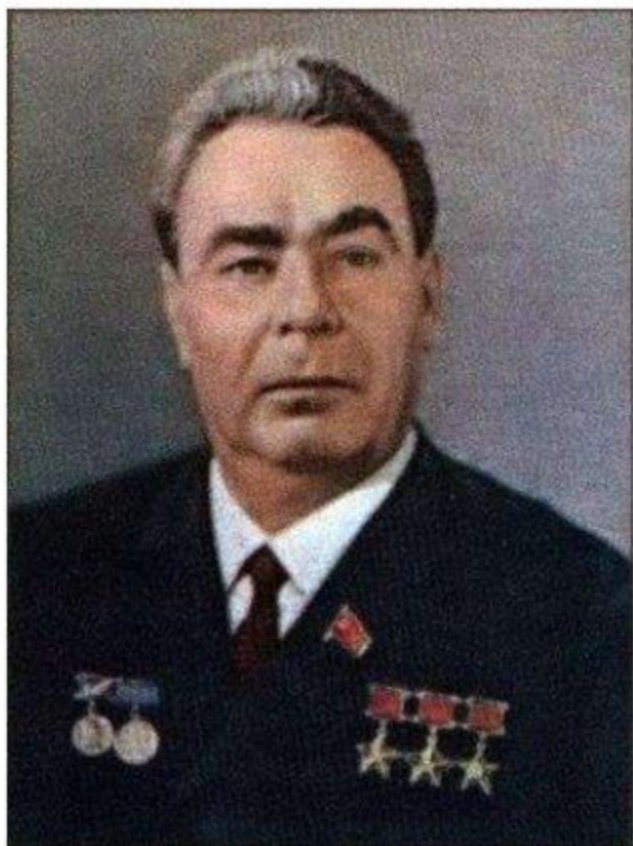
Л.И. Брежнев 1964 -1982