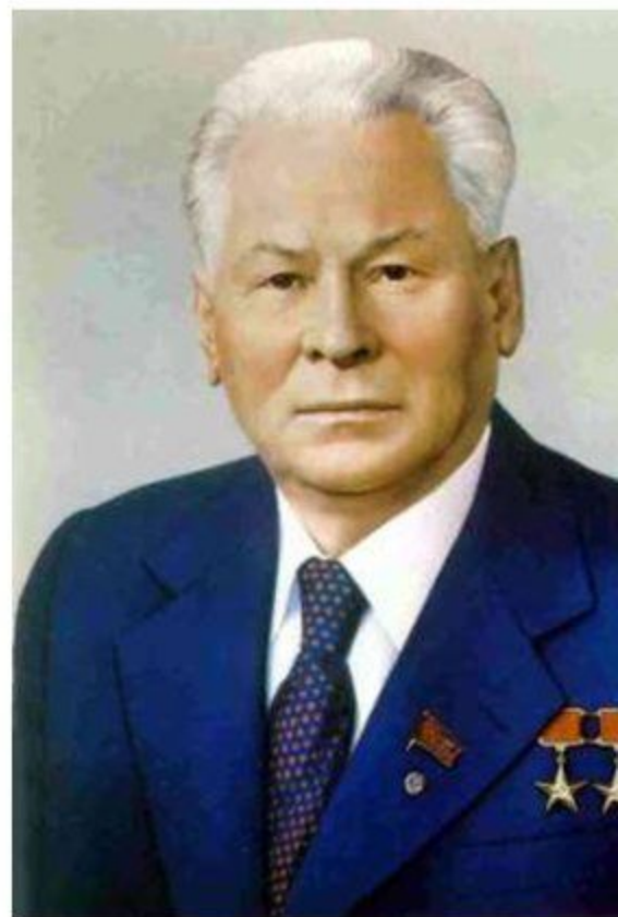
К.У. Черненко 1984 - 1985