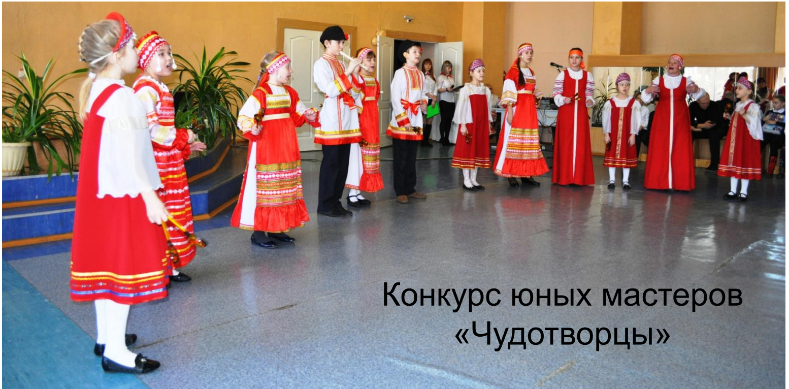
Конкурс юных мастеров «Чудотворцы»