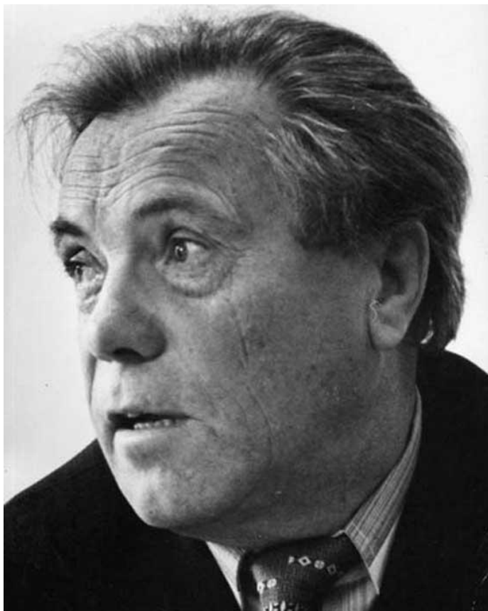
Аста́фьев Виктор Петро́вич 1924-2001