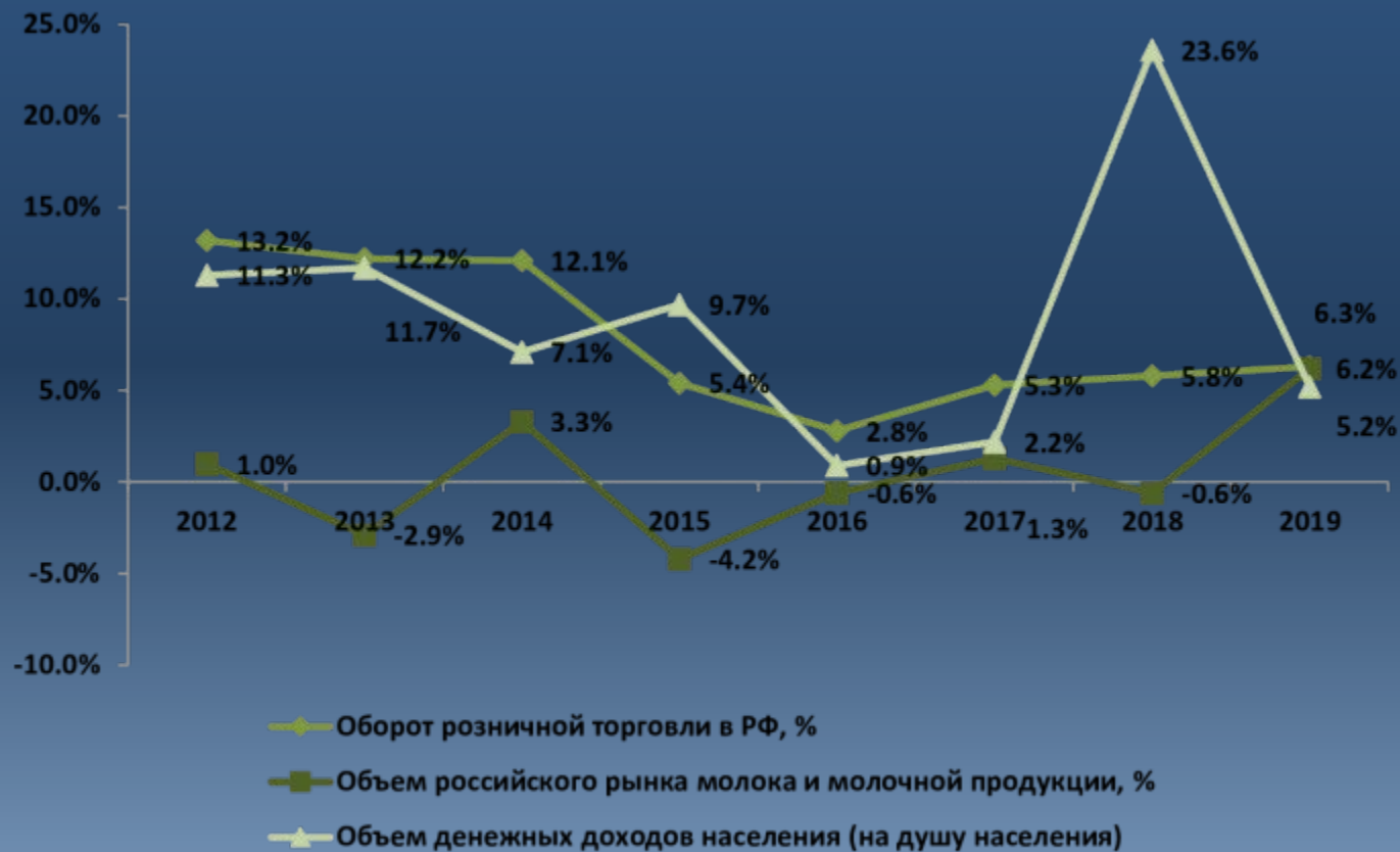
Рис. 1. Динамика объема российского рынка молока и молочной продукции на фоне основных макроэкономических показателей, 2012-2019 г., %