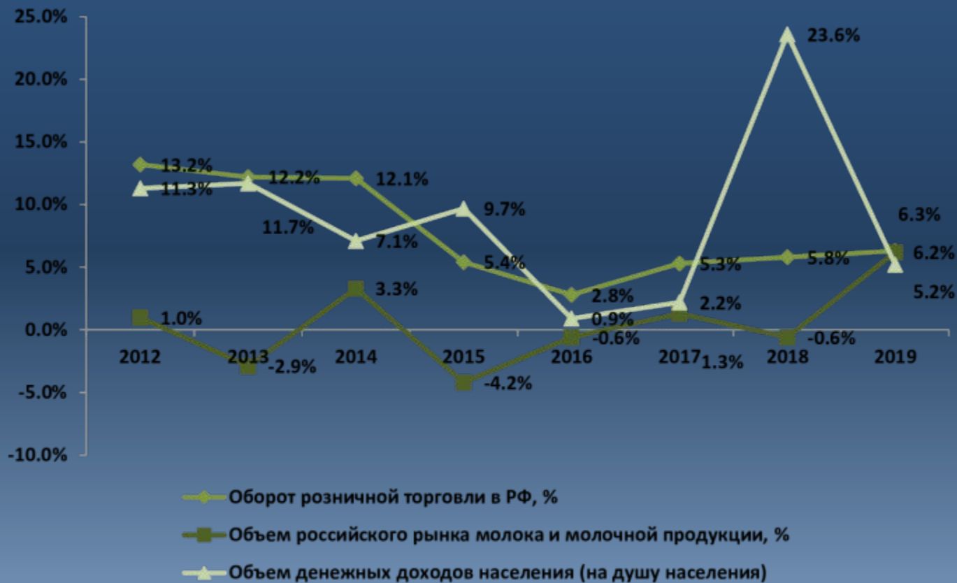
Рис. 1. Динамика объема российского рынка молока и молочной продукции на фоне основных макроэкономических показателей, 2012-2019 г., %