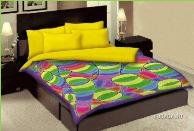
2-bed – двухспальная кровать

2-bed, 1,5-bed, 1-bed — для двух, полутора и односпальной постели соответственно: