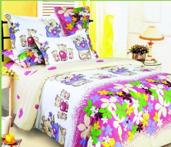
1-bed – односпальная кровать