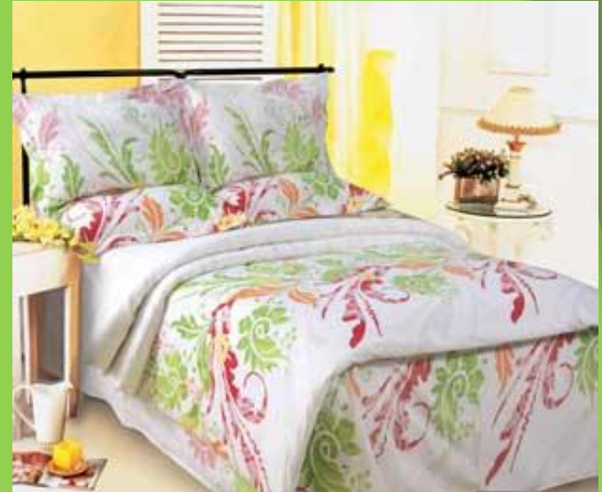
1,5-bed – полуторная кровать