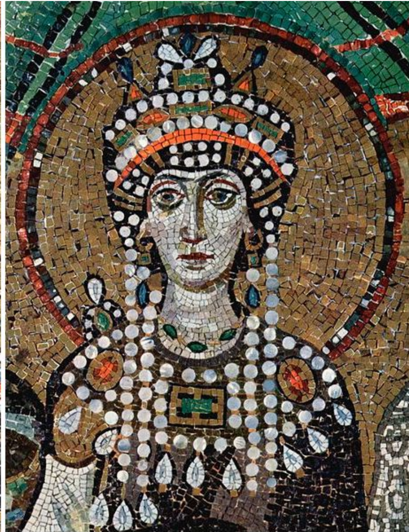
La emperatriz Teodora