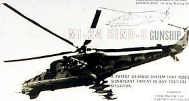
MI-24 HIND-D GUNSHIP

FOUR 23mm AA GUNS ON A COMMON MOUNTING. FOUR GUNS FIRE TOGETHER FOR MAXIMUM VOLUME OF FIRE. EMPLOYED AS LOW LEVEL AA TROOP PROTECTION.