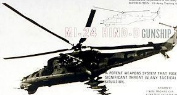
MI-24 HIND-D GUNSHIP

FOUR 23mm AA GUNS ON A COMMON MOUNTING. FOUR GUNS FIRE TOGETHER FOR MAXIMUM VOLUME OF FIRE. EMPLOYED AS LOW LEVEL AA TROOP PROTECTION.