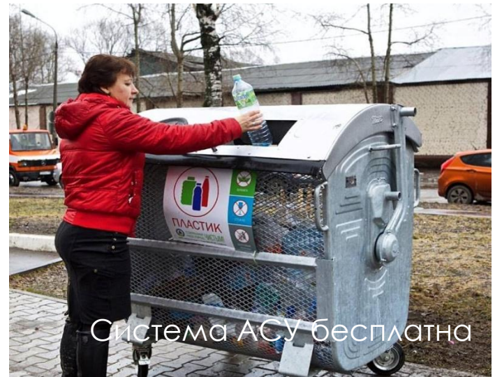
Система АСУ бесплатно