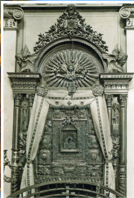
Язычный образ – чудотворная Казанская икона Божьей Матери (1890-е годы)