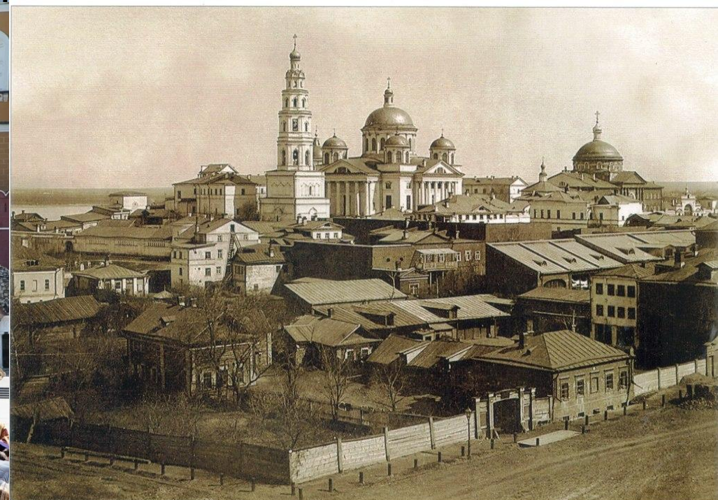
Вид на Казанский Богородицкий монастырь с кремлевского холма, 90-е годы XIX в.