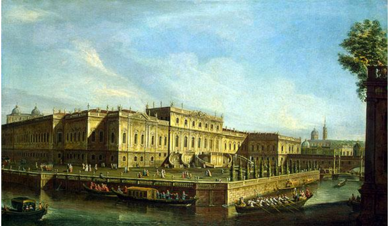
Летний дворец Елизаветы Петровны (построен в 1741, снесён в 1797).