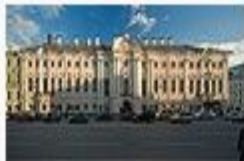
Дворец Строгановых в Петербурге