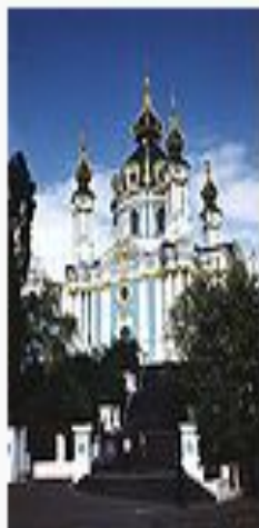
Андреевский собор в Киеве