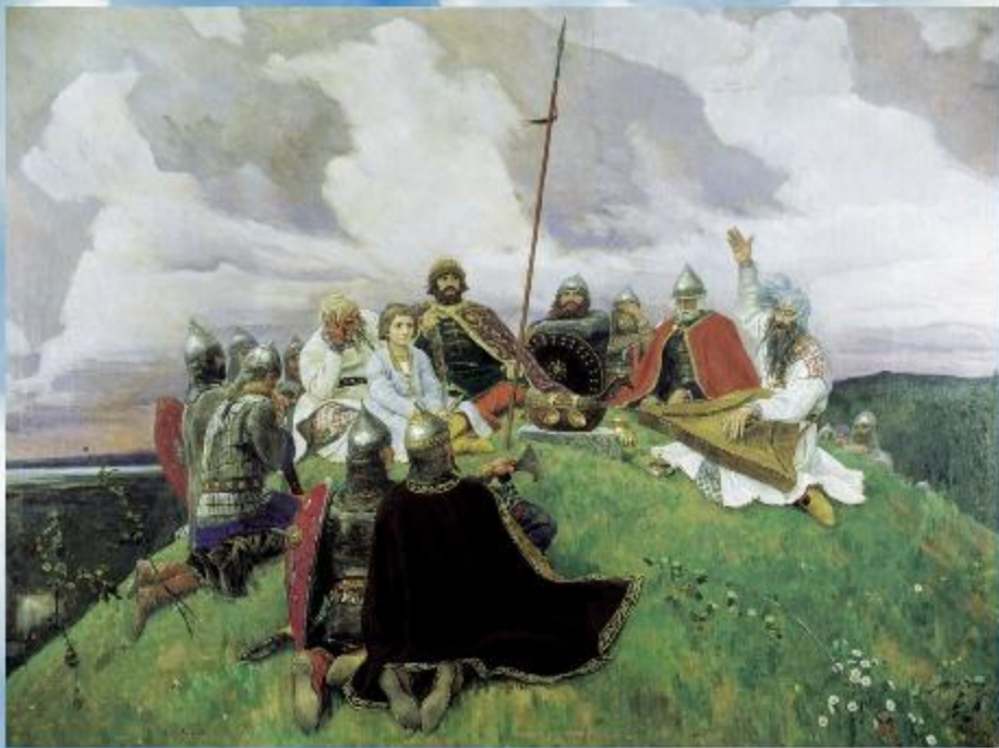
В.М.Васнецов «Баян» 1910г.

В душе художника всегда жили образы народного эпоса.