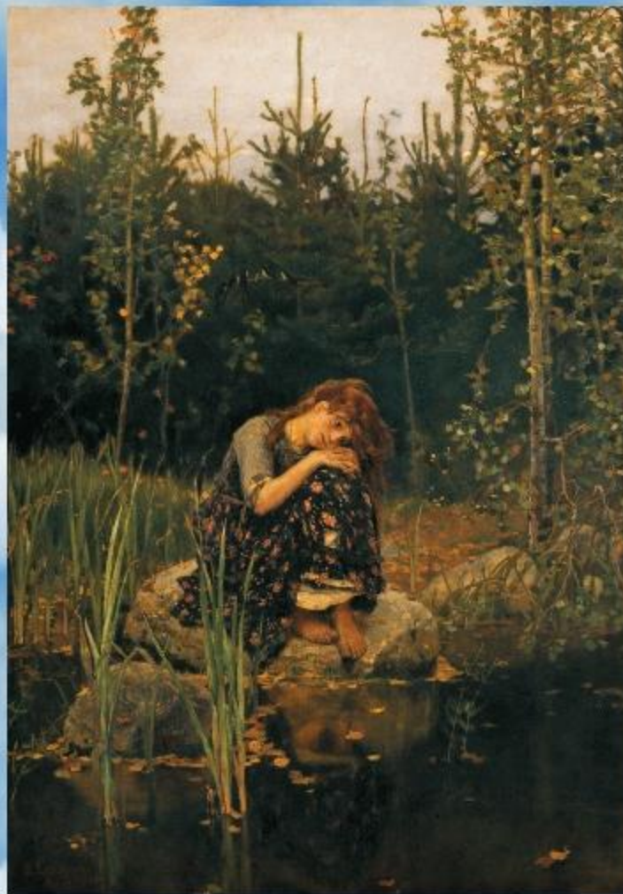
В.М.Васнецов «Алёнушка» 1881г.

«Алёнушка как будто давно жила в моей голове, но реально я увидел ее в Ахтырке (вблизи Абрамцева), когда встретил одну простоволосую девушку, поразившую мое воображение, – говорил Васнецов. – Столько тоски, одиночества, чисто русской печали было в её глазах... Каким-то особым русским духом повеяло от нее».