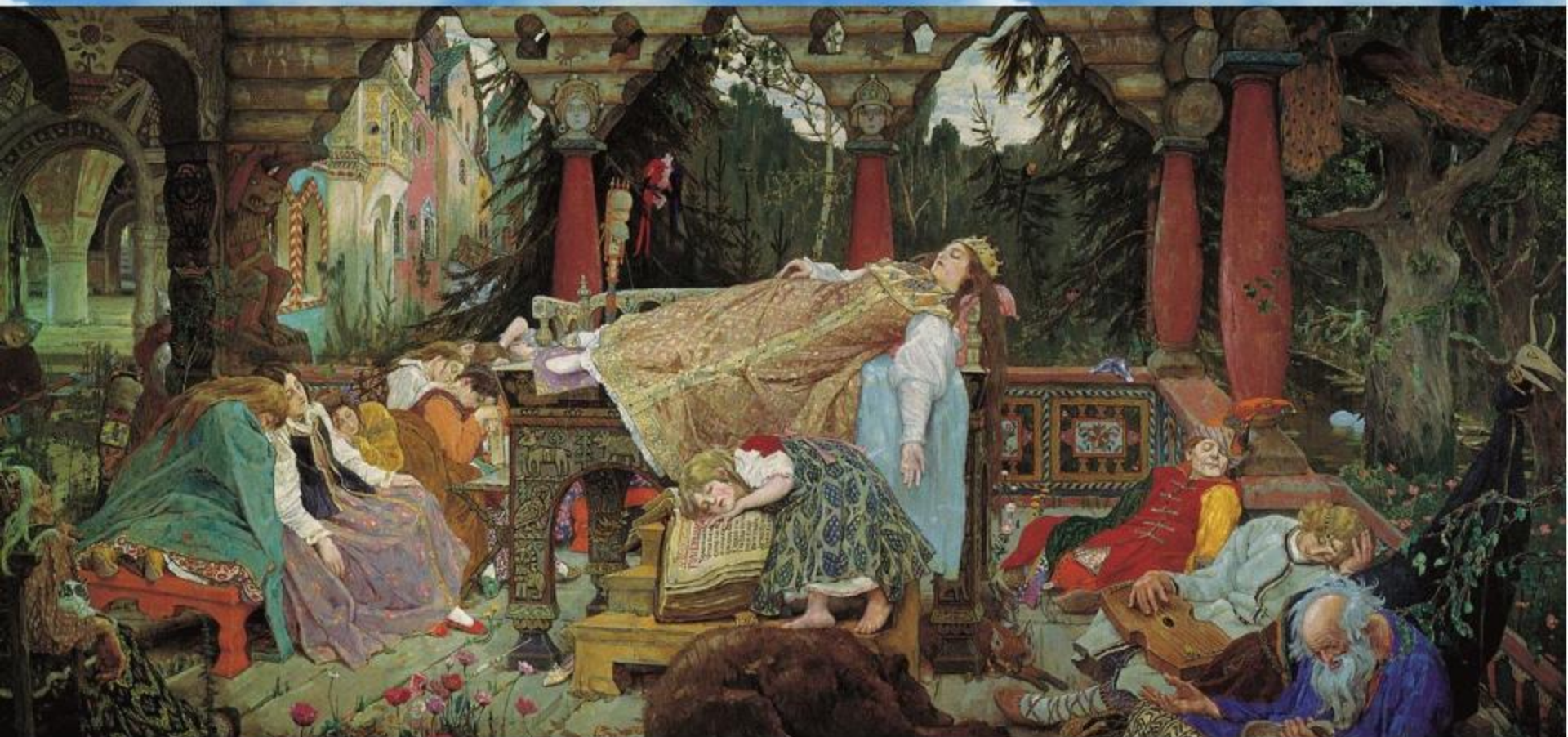
В.М.Васнецов «Спящая царевна» 1900-1926г.