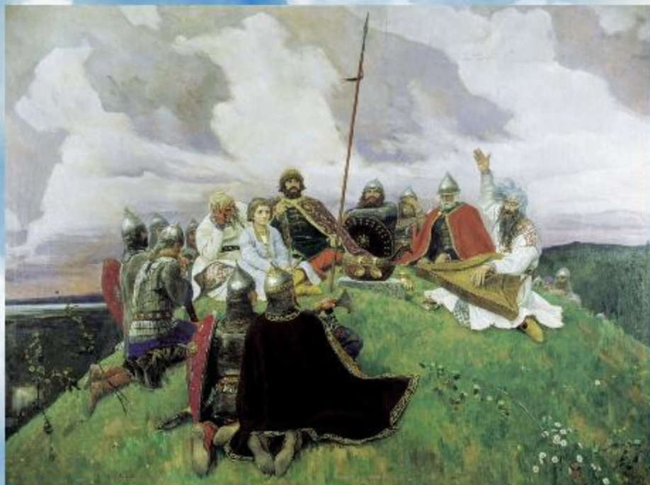
В.М.Васнецов «Баян» 1910г.

В душе художника всегда жили образы народного эпоса.