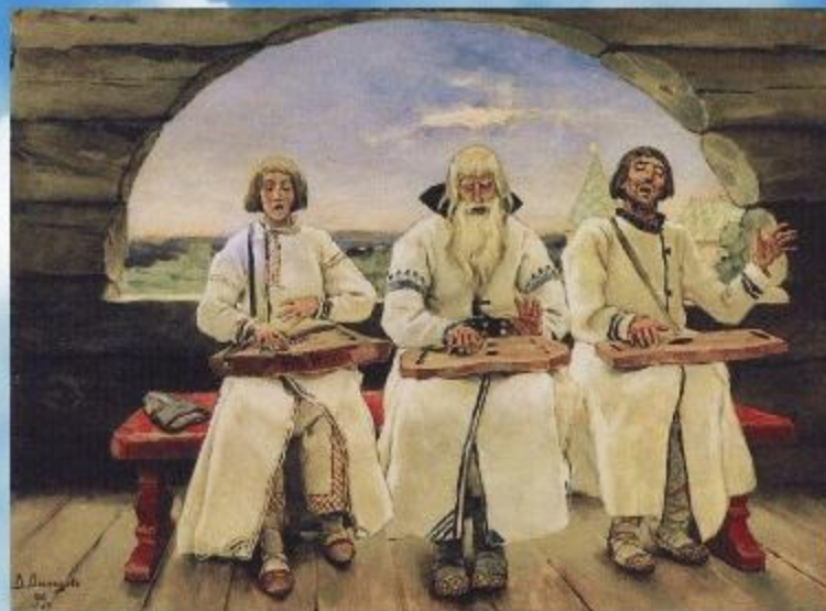
В.М.Васнецов «Гусляры» 1899г.