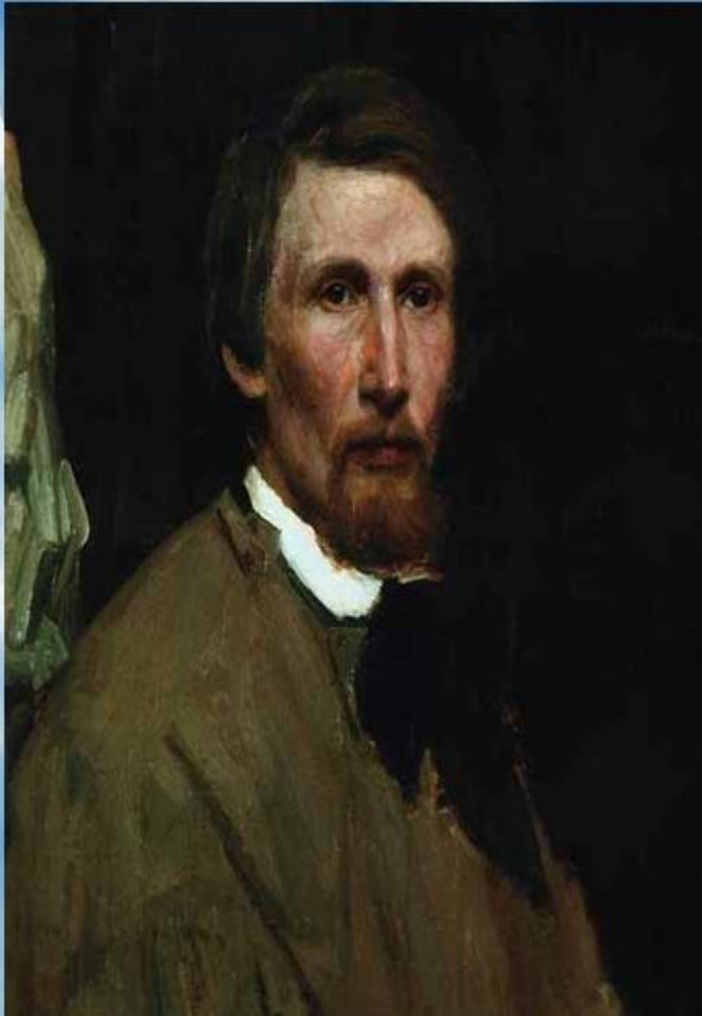
Васнецов Виктор Михайлович (1848-1926)