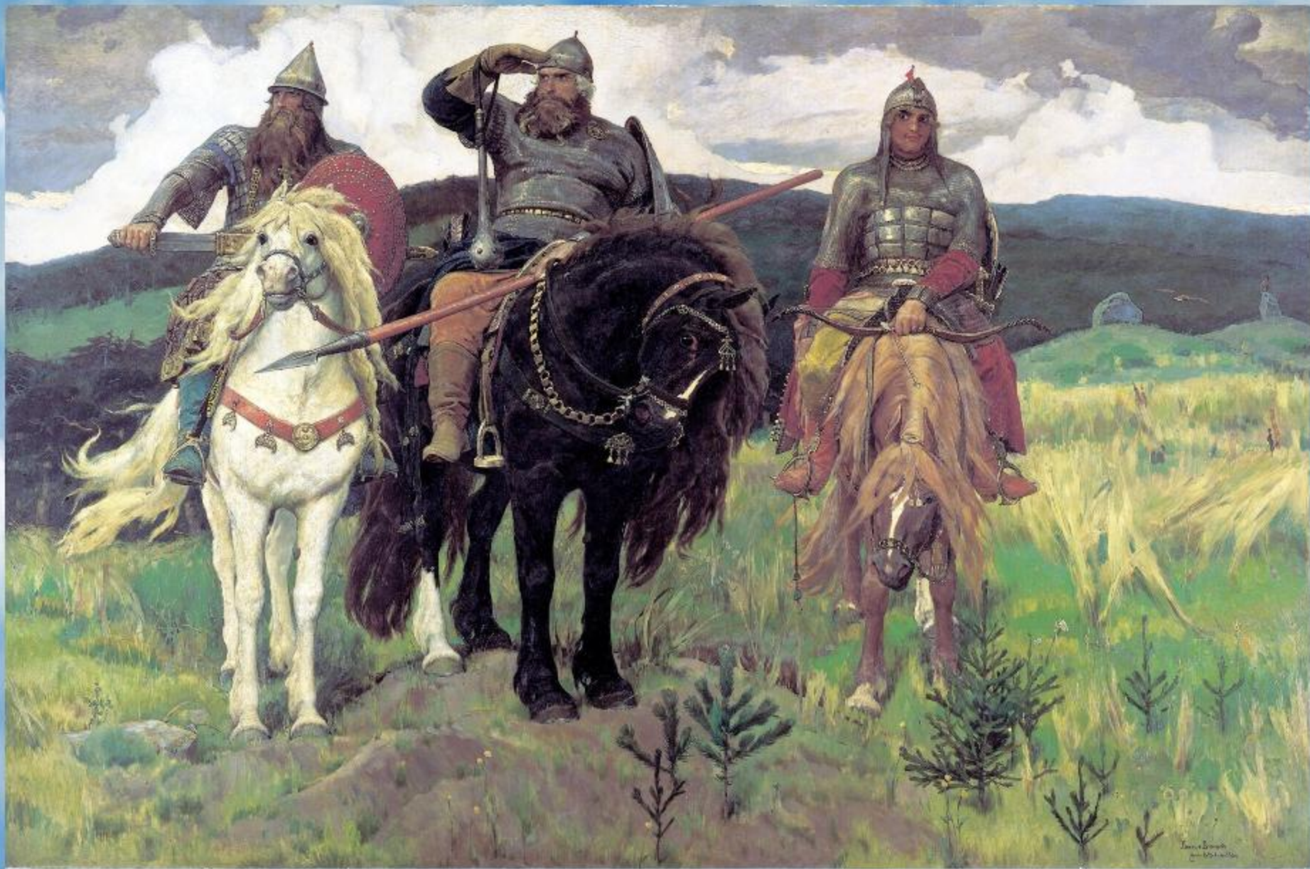
В.М.Васнецов «Богатыри» 1881г.-1898г.