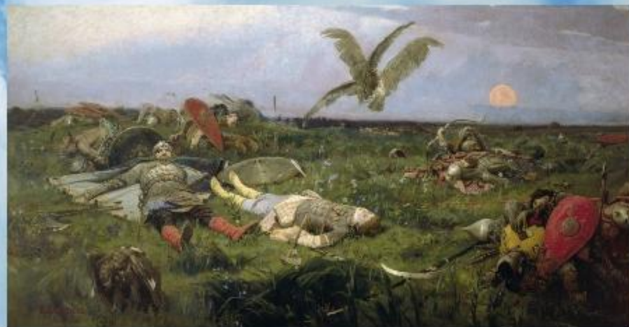
В.М.Васнецов «После побоища Игоря Святославича с половцами». 1880г