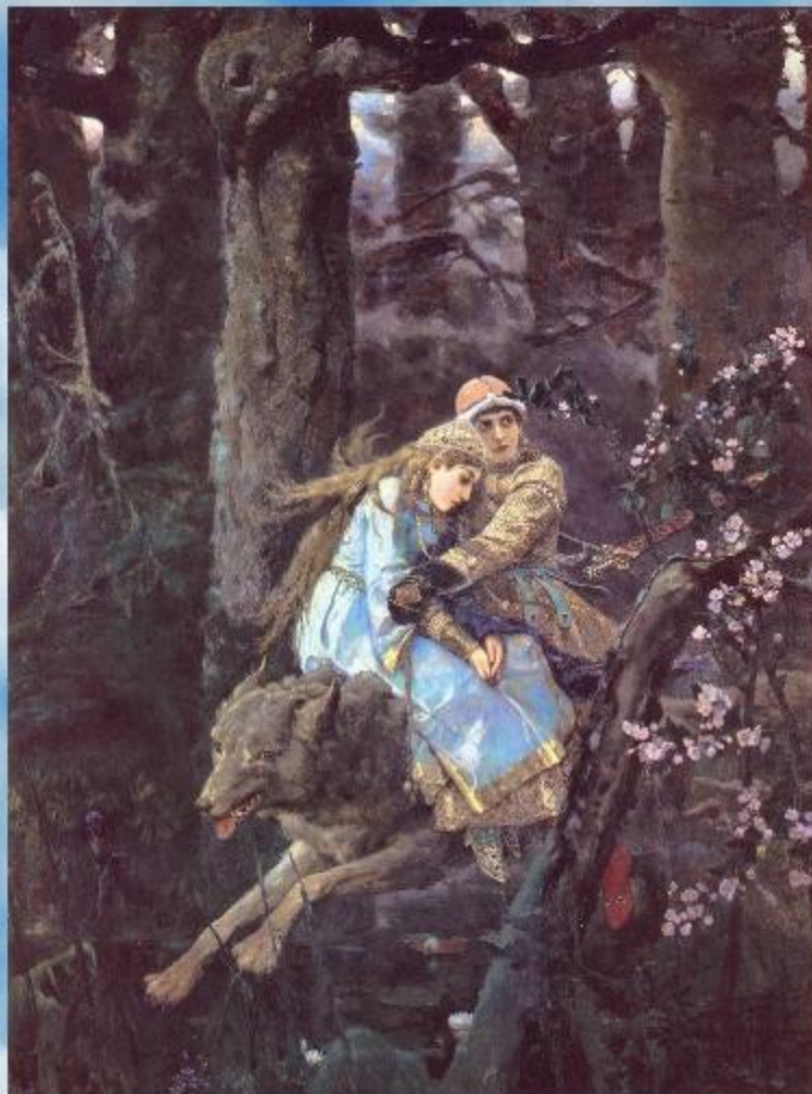
В.М.Васнецов «Иван Царевич на Сером Волке» 1889г.

Девушка доверчиво прильнула к царевичу. Как говорится в сказке, «Иван Царевич, сидя на Сером Волке с прекрасною Еленою, возлюбил её всем сердцем, а она – Ивана Царевича». Именно этот свет любви, который словно изнутри излучают их фигуры, защищает и хранит героев картины в подступившей вплотную тьме. И там, где они проплывают над землёй, происходит чудо – мёртвое дерево расцветает весенними нежными цветами.