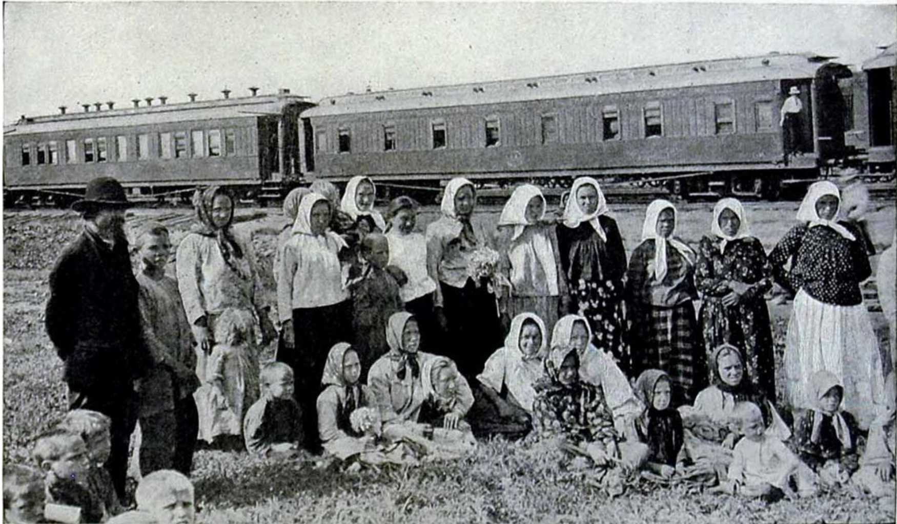
SUNDAY IN SIBERIA : VILLAGERS ASSEMBLED AT A TRANS-SIBERIAN RAILWAY STATION TO VIEW A PASSING TRAIN Siberian life is by no means uncongenial to its natives, who are well able to resist the extremes of temperature. Usually regarded as a country of intense cold and eternal snow, Siberia is seldom pictured in its summer garb, when the woods and wide stretches of plain are resplendent with a rich, ripe vegetation, and numerous flowers and berries may be had for the gathering. And there are vast regions, chiefly in the steppe zone, where the earth is of such unfailing fertility that the Siberians say of it: "When tickled with the hoe it laughs with a harvest"