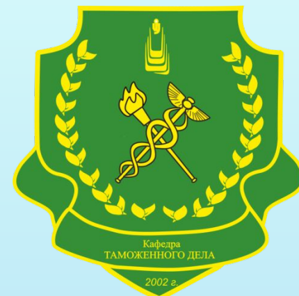
Эмблема кафедры ТД