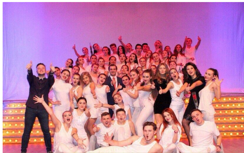
Победа Института менеджмента в фестивале «Студенческая осень-2016»