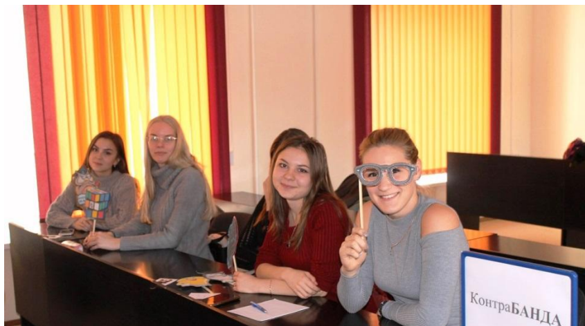
Интеллектуальная игра «Что? Где? Когда?»