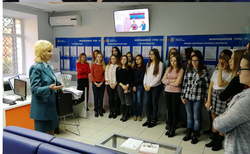
Посещение Отделения по Оренбургской области Уральского главного управления Центрального Банка РФ