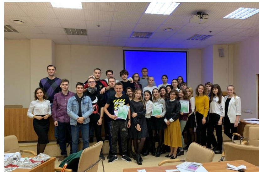
Ежегодные мероприятия в честь Дня таможенника