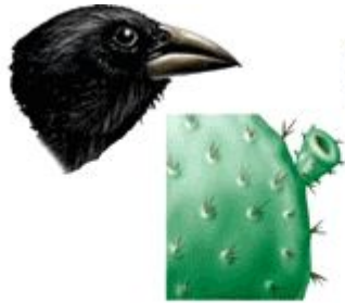
Cactus finch (cactus fruits and flowers)