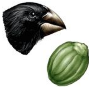
Large ground finch (seeds)