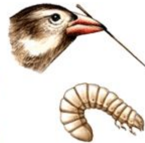
Woodpecker finch (insects)