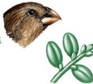
Vegetarian finch (buds)