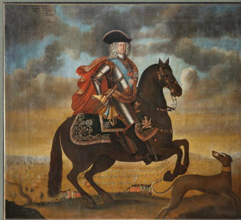
Б. П. Шереметев. Худ. К. Шурман.

Строительство крепости шло полным ходом, когда главные силы шведов заняли деревню Костеничи под Мглином. 3 октября в Почеп прибыл фельдмаршал Б. П. Шереметев с дивизией. В течение последующих нескольких дней к городу стянулись значительные силы русской армии. Таким образом, наша армия, предупредив авангарды противника, предотвратила захват ими Почепа и закрыла ему путь на Брянск и далее на Москву. Б. П. Шереметев собрал здесь тайный военный совет генералов и министров, на котором решали, как поступить далее.