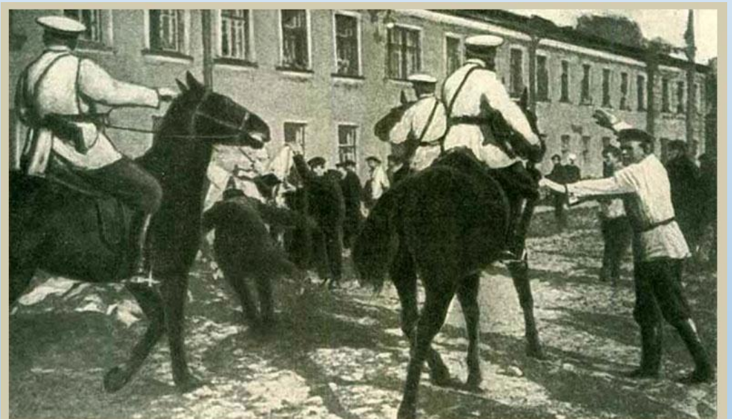
Разгон полицией бастующих рабочих Обуховского завода 7 мая 1901 года.