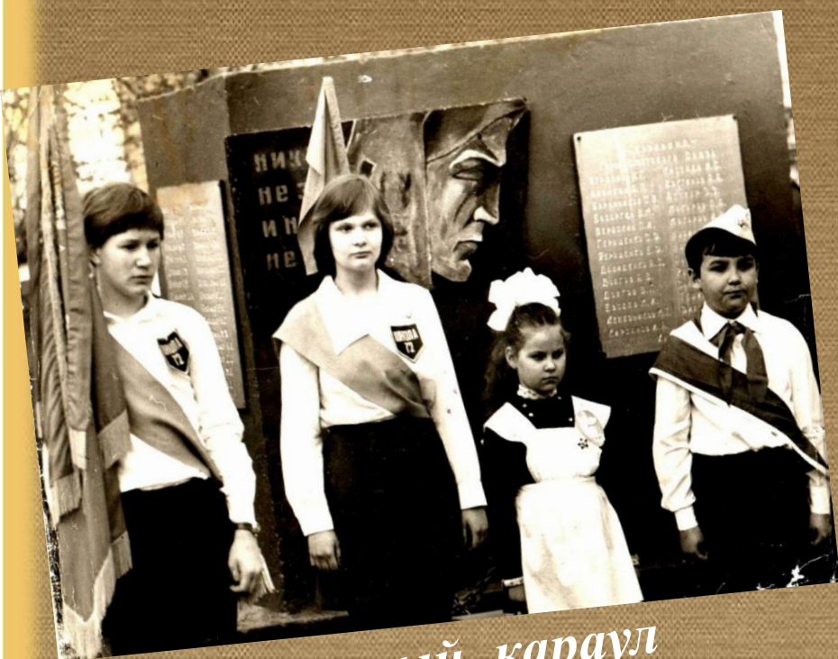
Почетный караул комсомольцев и пионеров возле памятника