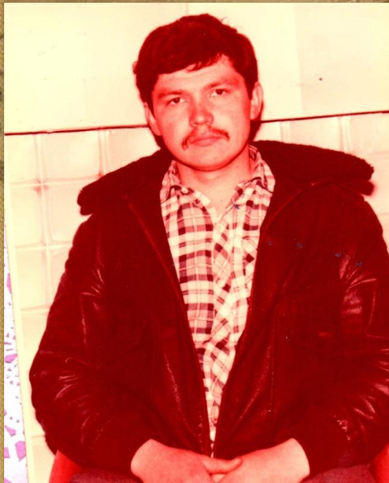
Начало трудовой деятельности в колхозе им. К. Маркса. зав. мастерскими

Дай нам, Родина, новых просторов - Новым трудностям в очи глядеть. Мы готовы к делам, о которых Говорят: легче шторм одолеть