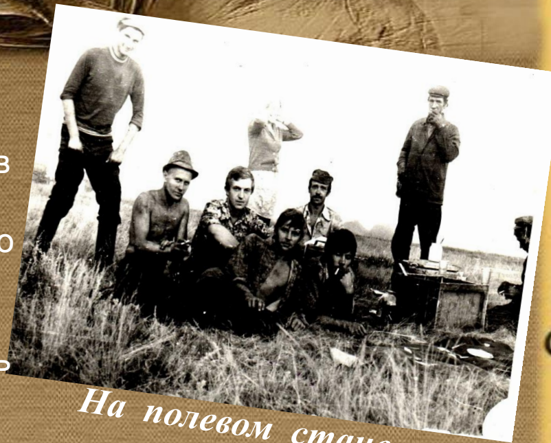
На полевом стане. Уборочная

Дай нам, Родина, новых просторов - Новым трудностям в очи глядеть. Мы готовы к делам, о которых Говорят: легче шторм одолеть