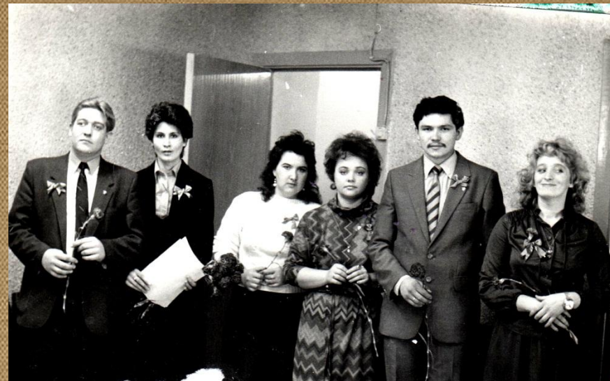
1987г. Второй секретарь