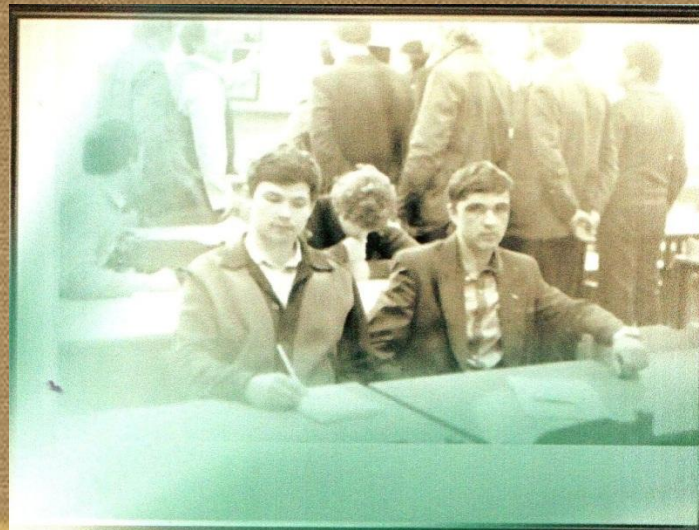
Повышение квалификации Ростов - на - Дону