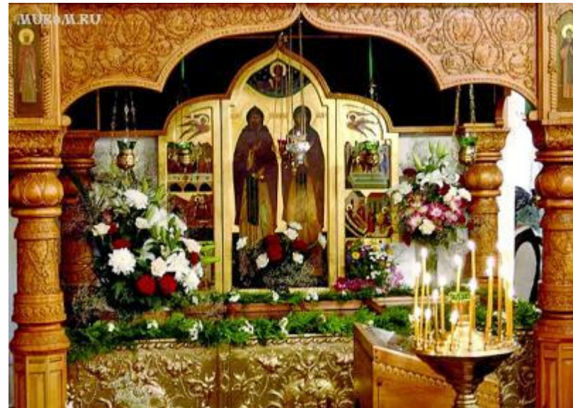
Рака с мощами святых под высокой иконой в золочёном окладе.

- Погребены были святые супруги в соборной церкви города Муром в честь Рождества Пресвятой Богородицы, возведённой над их мощами по обету Иваном Грозным в 1553 году, ныне открыто почивают в храме Святой Троицы Свято-Троицкого монастыря в Муроме.