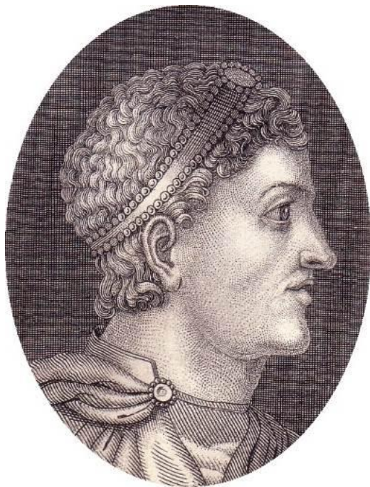
Феодосий I 347–395 гг.

Установил мир с германцами и взял их на государственную службу.