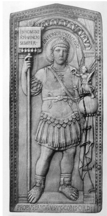
Гонорий 384–423 гг.