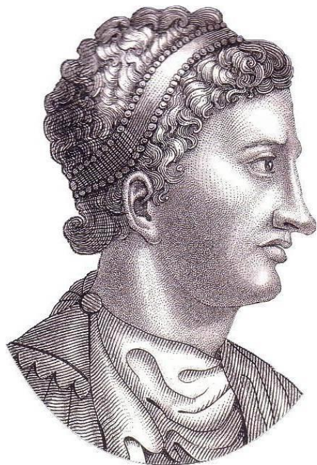
Аркадий 377–408 гг.