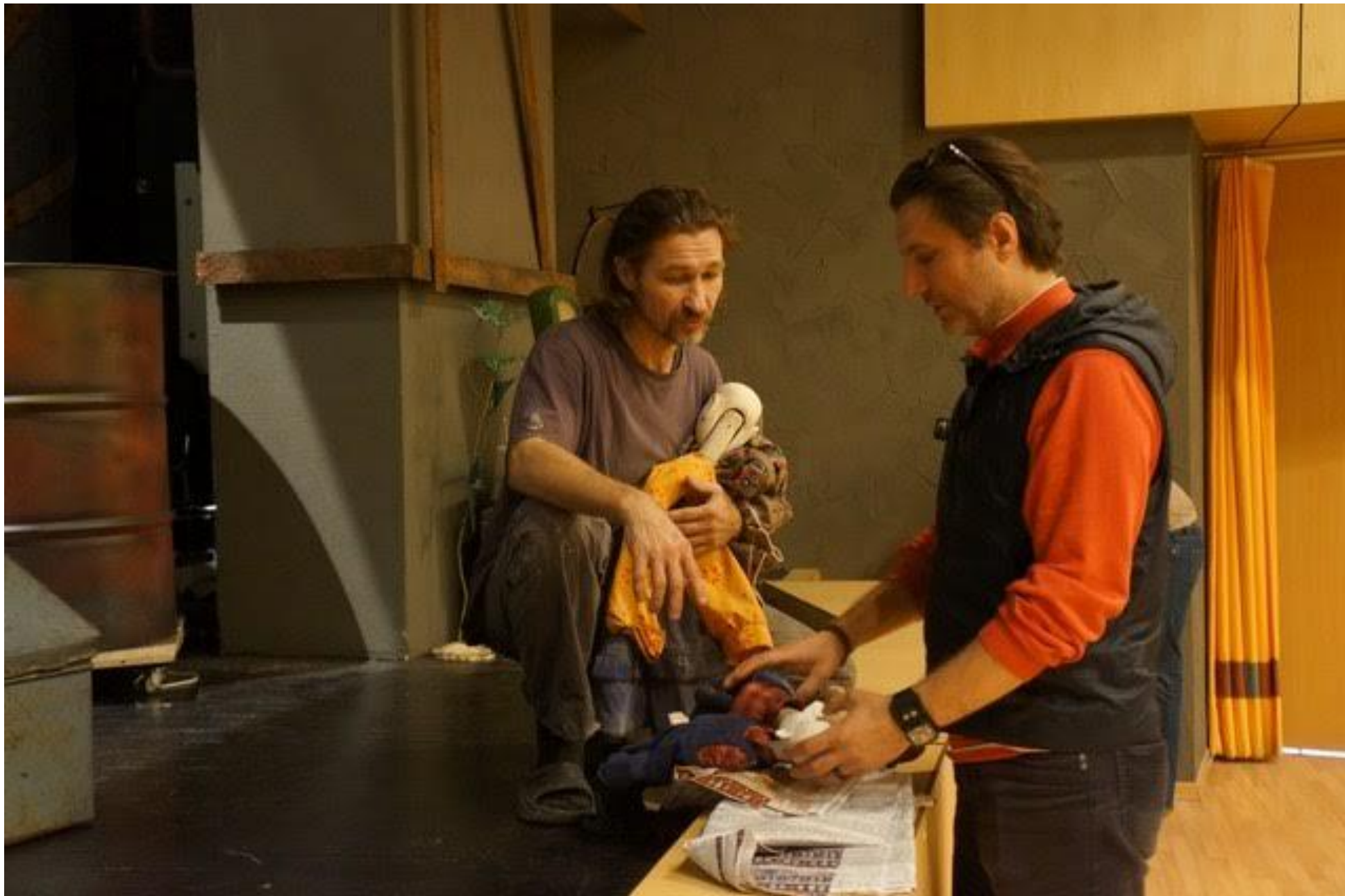
Работа над спектаклем