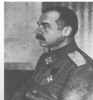
А. М. Каледин