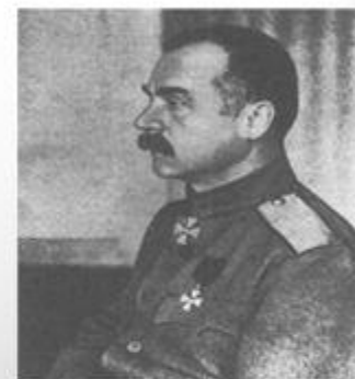
А. М. Каледин