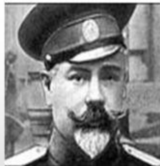
А. И. Деникин