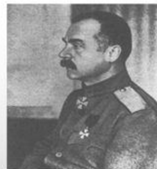
А. М. Каледин