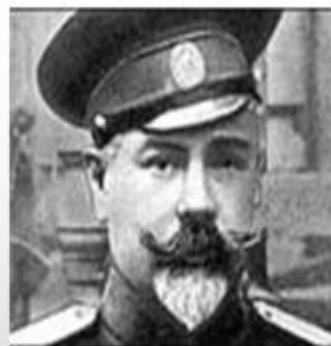
А. И. Деникин