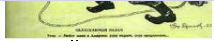
Карикатура на Иосипа Броз Тито