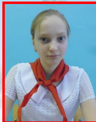
ПРЕЗИДЕНТ ШКОЛЬНОЙ РЕСПУБЛИКИ «Данко»