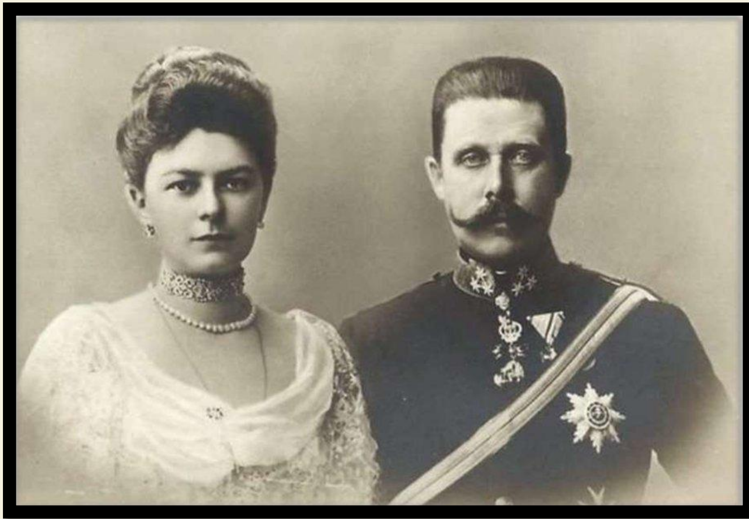
Эрцгерцог Австро-Венгрии Франц Фердинанд и его жена София Хотек