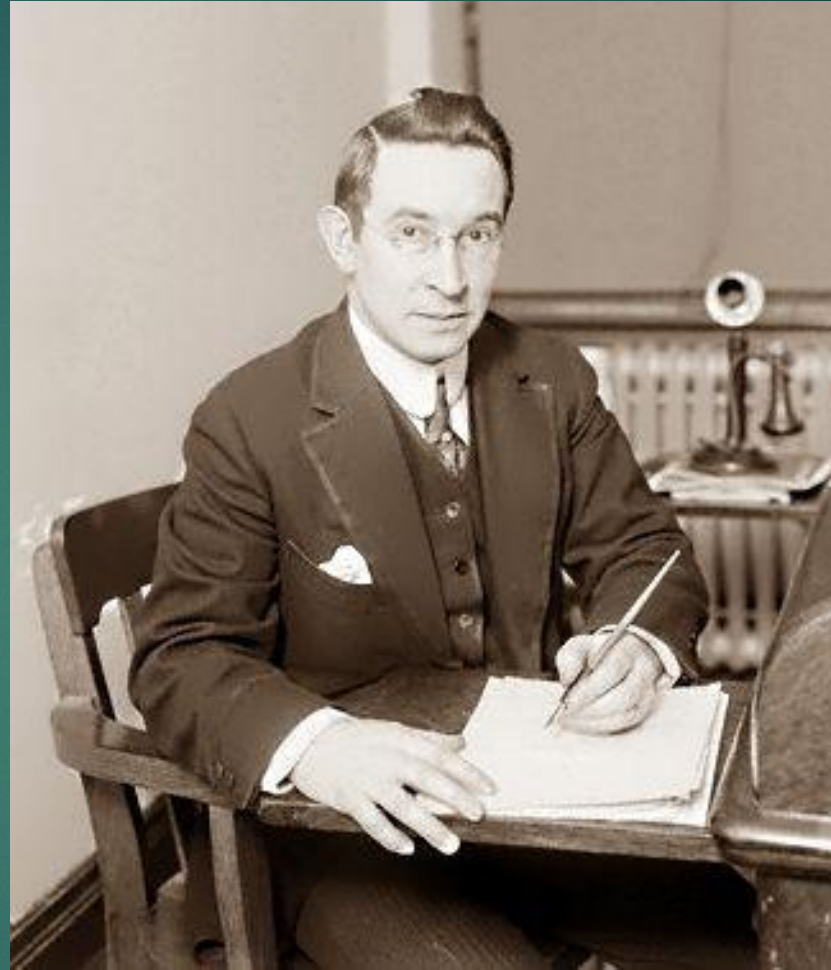
Берти Чарльз Форбс

Всемирно известный деловой вестник — журнал Forbes был основан в начале XX века в «самом газетном городе мира» Нью-Йорке шотландским эмигрантом Берти Чарльзом Форбсом. Незадолго до этого молодой репортер уже успел сделать себе имя, работая под крылом медиамагната Уильяма Херста (сегодня Hearst Communications владеет Cosmopolitan, Esquire, Harper's Bazaar и др.). За 37 лет Форбс создал глянец, приносящий сотню тысяч чистой прибыли в год, его экстравагантный сын превратил издание в целую империю, а внук основателя сделал Forbes узнаваемым брендом во всем мире.