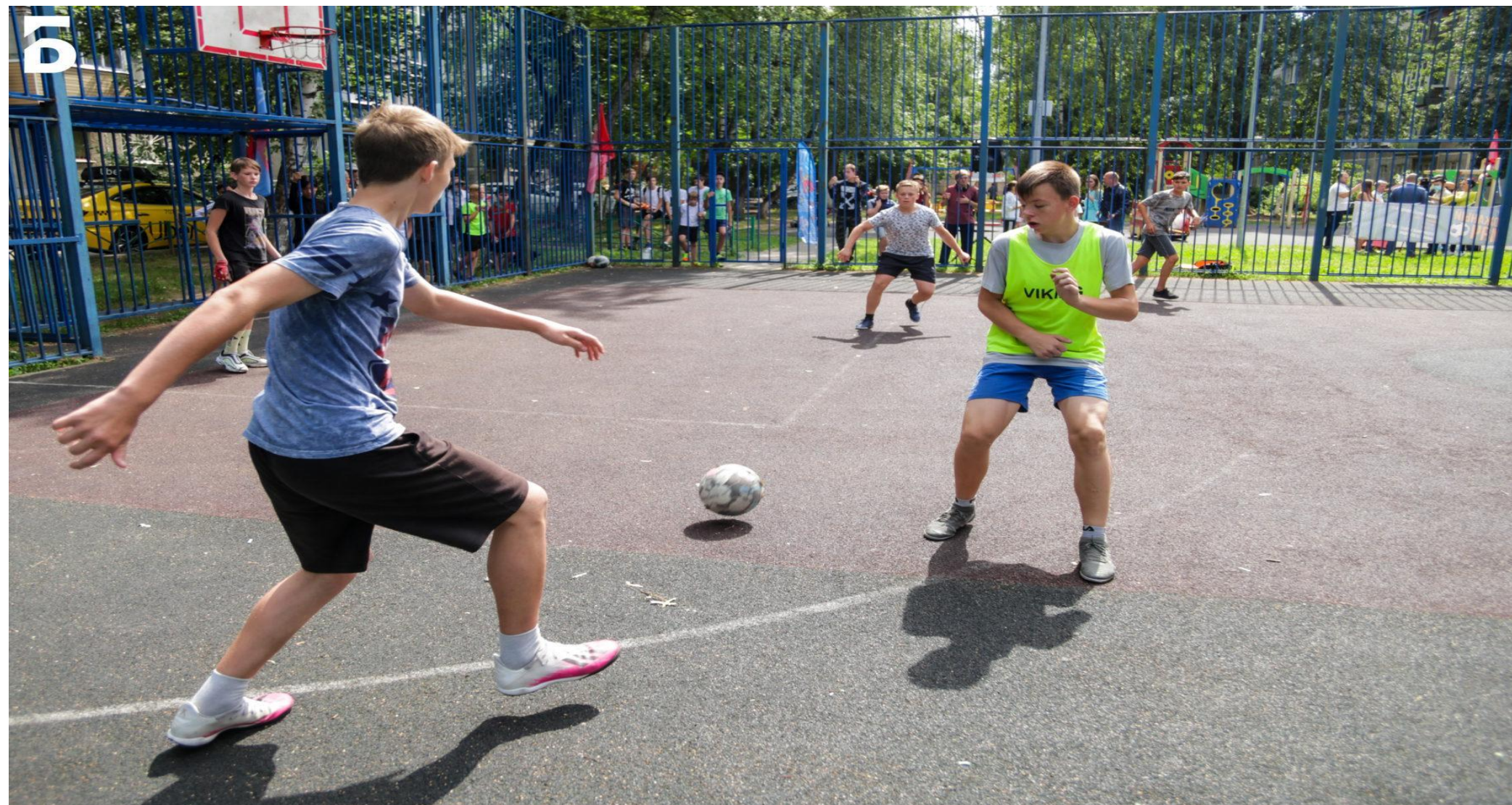
Результат проекта «Развитие футбола»